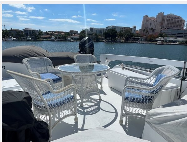
28. Flybridge Aft Deck