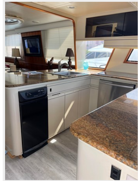
16. Galley view 3