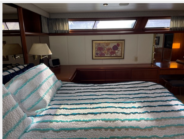
36. Master Stateroom view 3