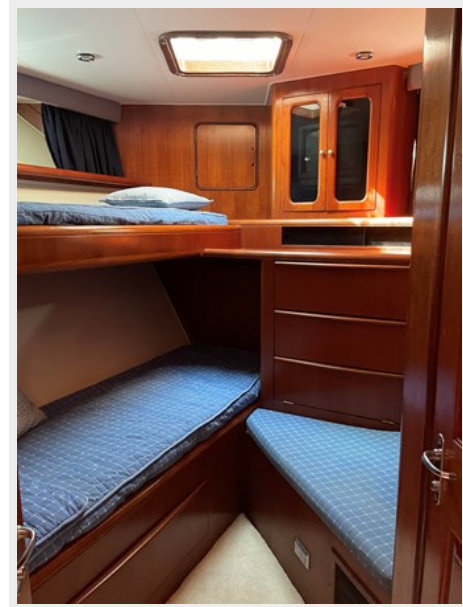
39. Forward Stateroom V-Birth