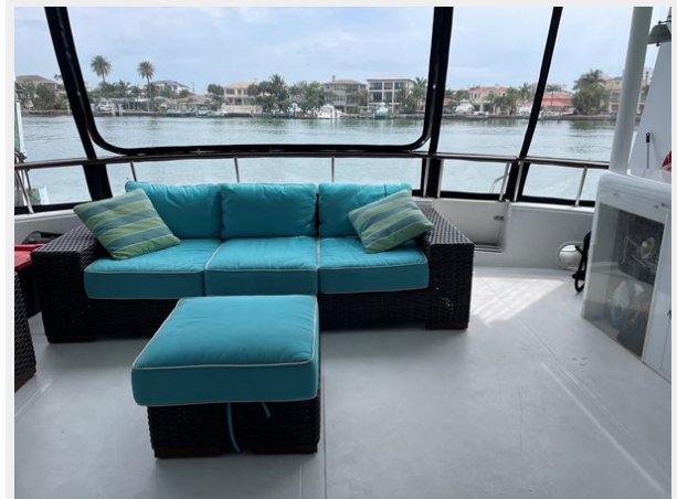
25. Aft Patio