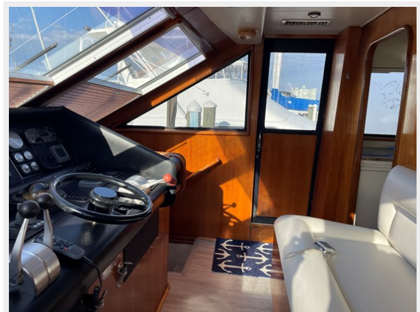
12. Helm view 3