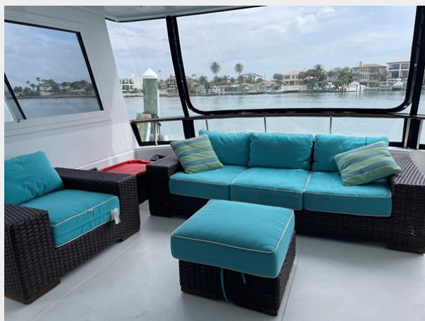
26. Aft Patio view 2