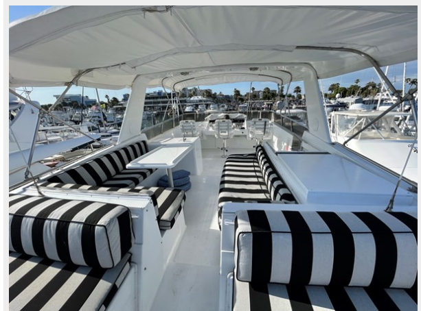
27. Flybridge Deck