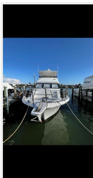
7. Front view 2