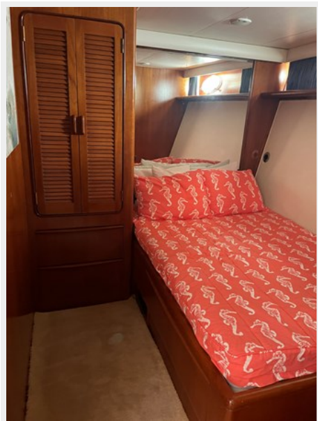
40. Forward Port Stateroom