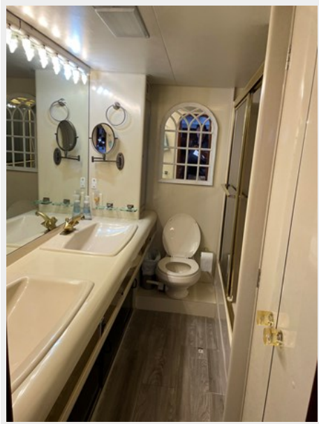
38. Master Bath view 2