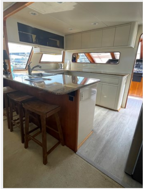
15. Galley view 2