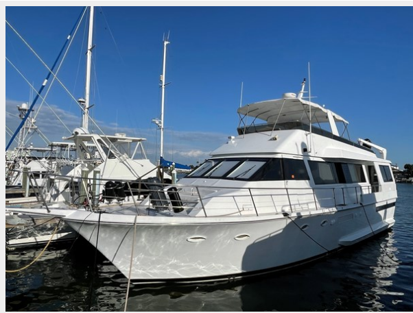
3. Port View