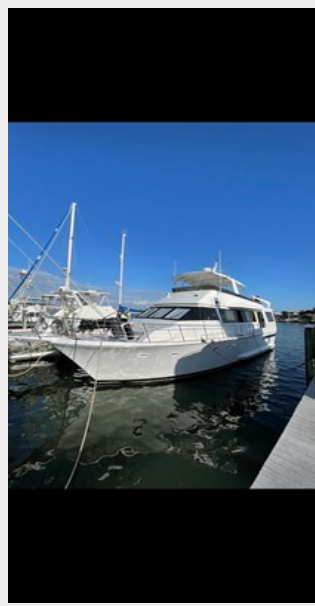
1. Full View