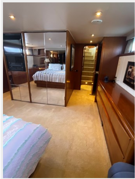
34. Master Stateroom view 2