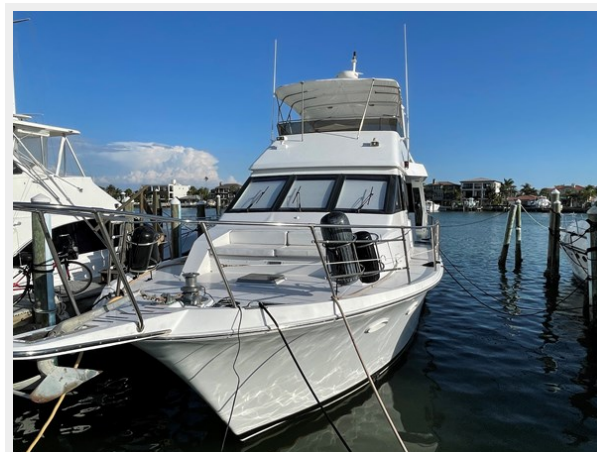
6. Port view 2