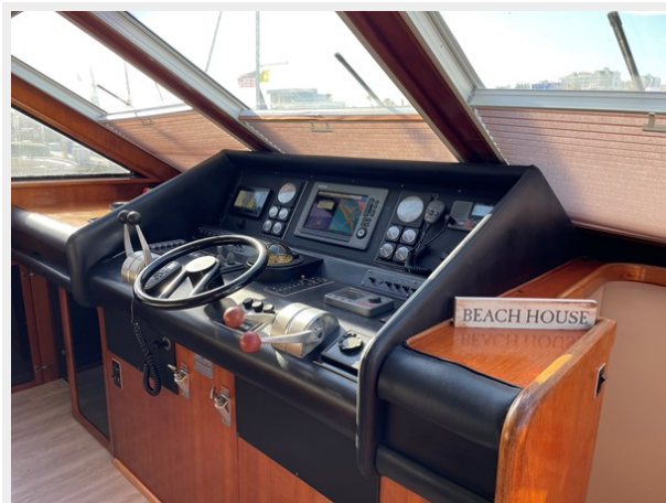
11. Helm view 2