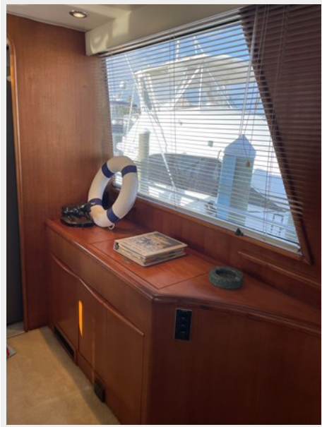
24. Salon view 4