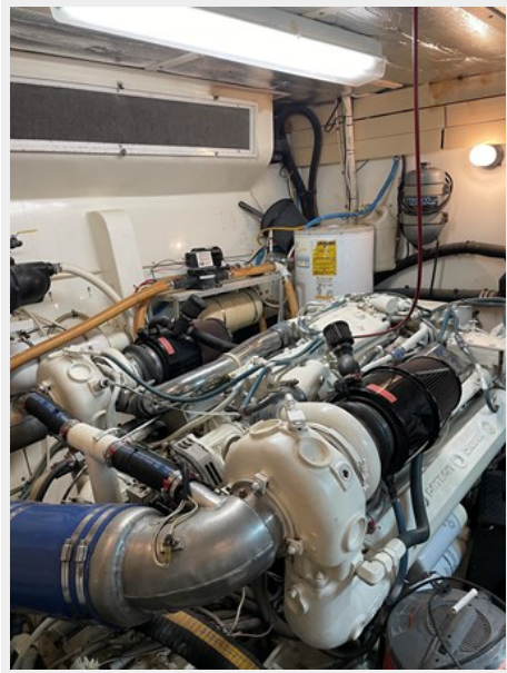
46. Port Engine