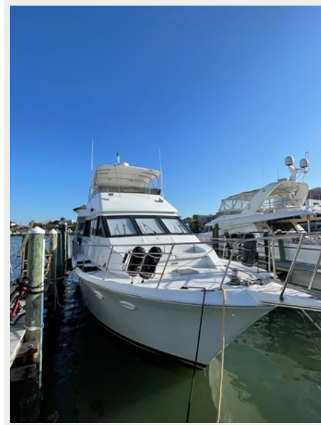
2. Starboard view