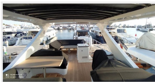
2016 Sea Ray L650 Fly - July 2021 phtos1