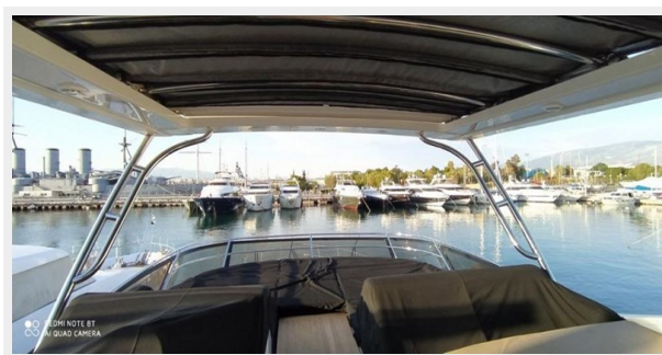
2016 Sea Ray L650 Fly - July 2021 phtos13