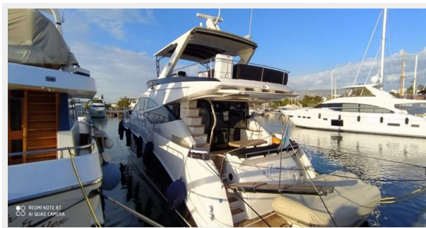
2016 Sea Ray L650 Fly - July 2021 phtos4