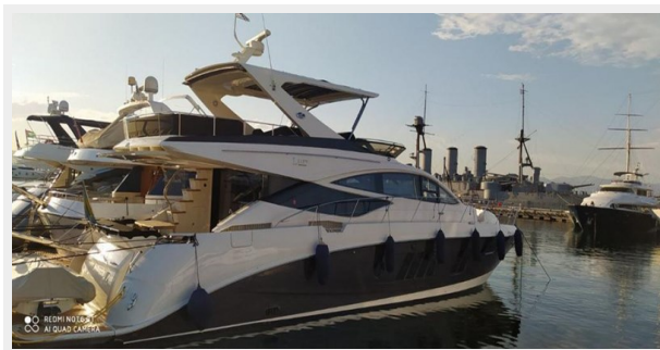
2016 Sea Ray L650 Fly - July 2021 phtos2