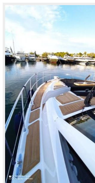
2016 Sea Ray L650 Fly - July 2021 phtos13