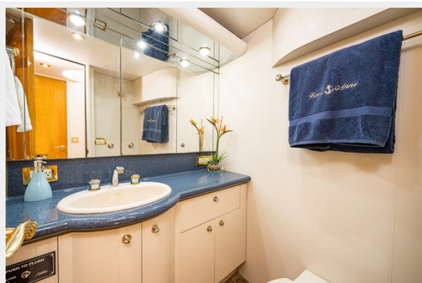
Forward Head Vanity