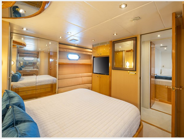
Owner Stateroom Port View