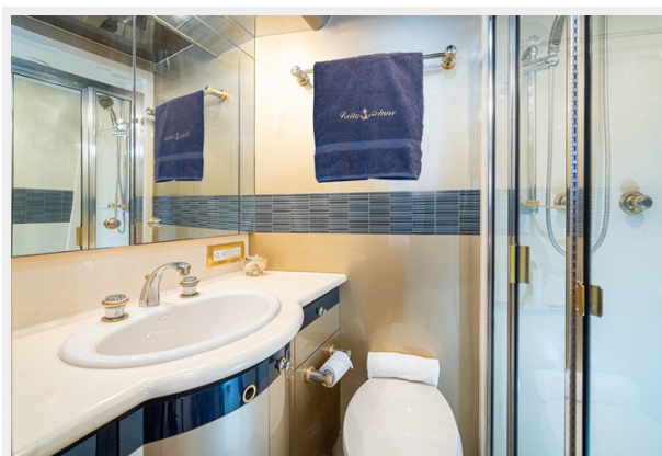
Port Guest Head