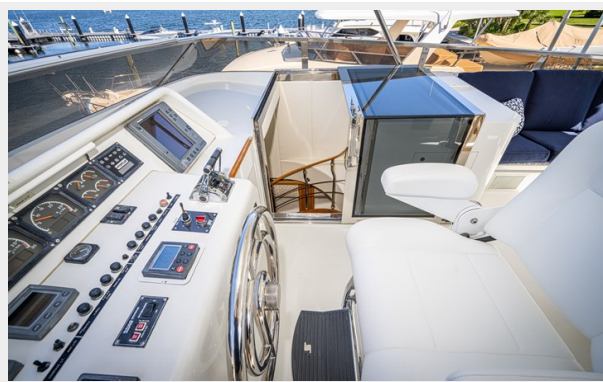
Flybridge Stair Access