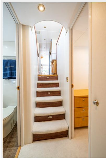
Forward Companionway Stairs