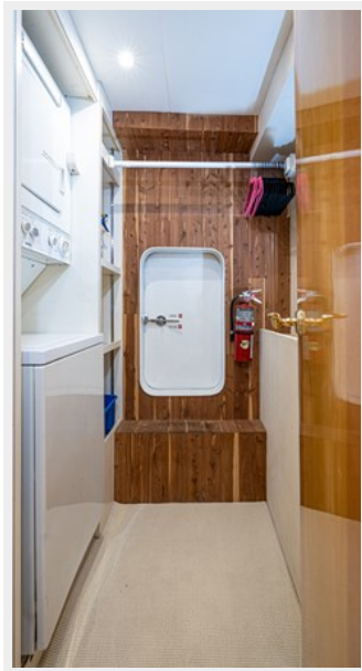
Owner Stateroom Walk In Closet