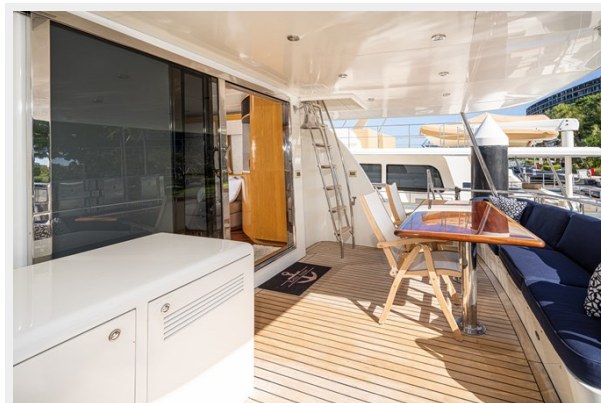
Aft Deck Starboard View