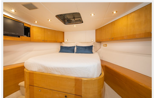
Forward VIP Stateroom