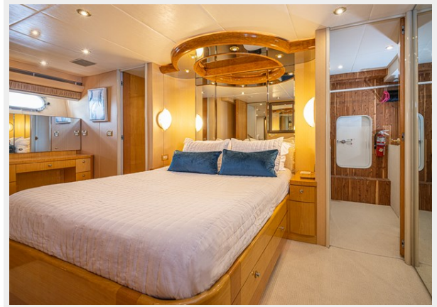
Owner Stateroom Closet