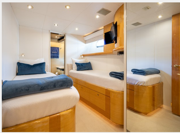
Starboard Guest Stateroom Forward