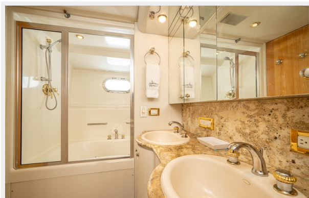
Owner Head Shower Tub