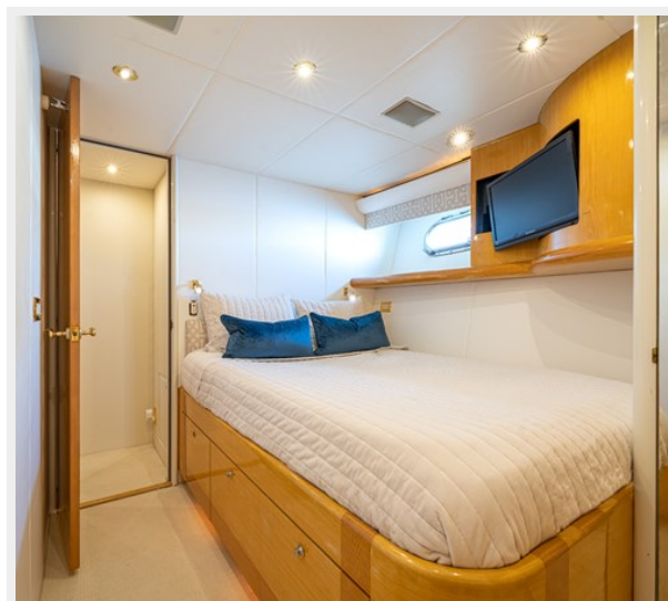
Port Stateroom Aft View