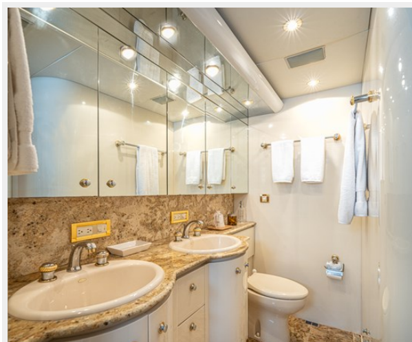
Owner Head Vanity