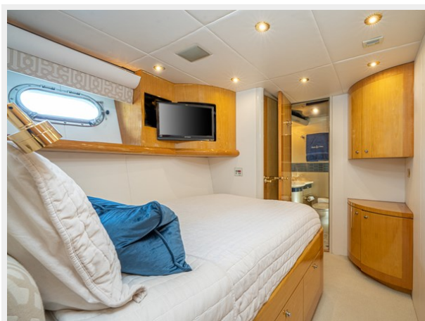
Port Guest Stateroom