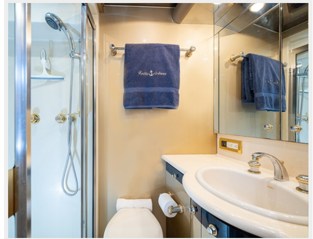
Starboard Guest Head