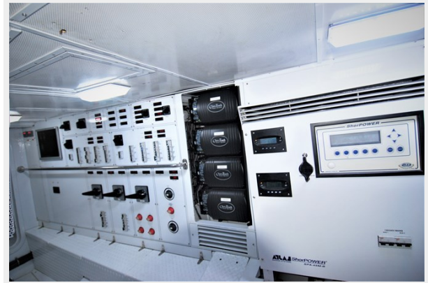
VAGABOND - Port Engine Room