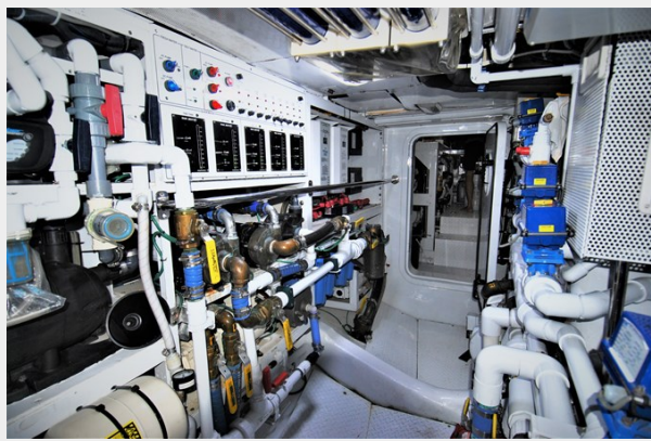
VAGABOND - Starboard engine room looking aft