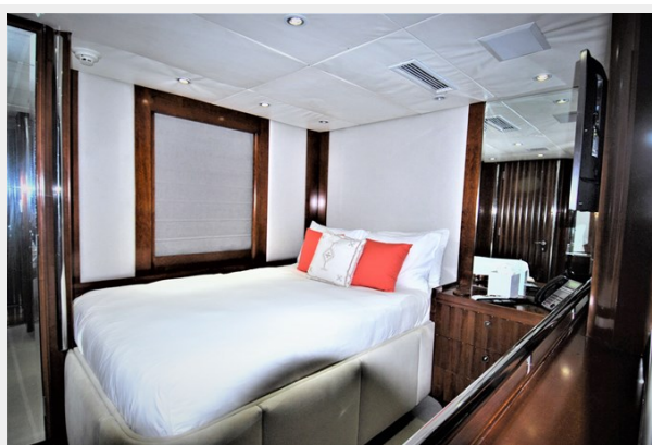
VAGABOND - Guest stateroom