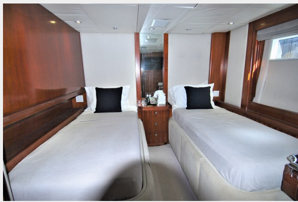
VAGABOND - Port guest cabin