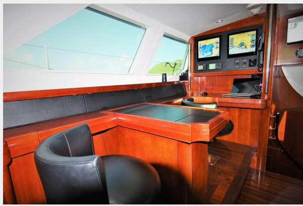
VAGABOND - Navigation area