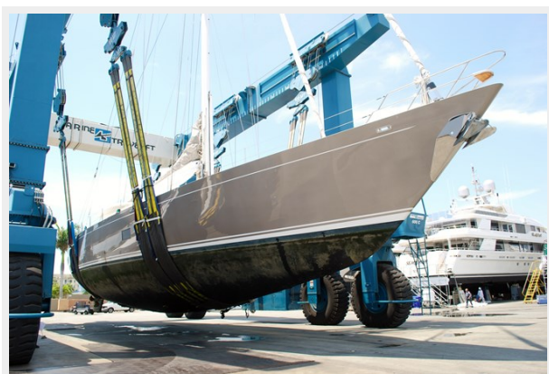
VAGABOND - Out of the water