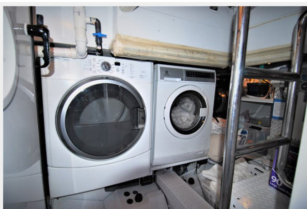
VAGABOND - Laundry room under galley