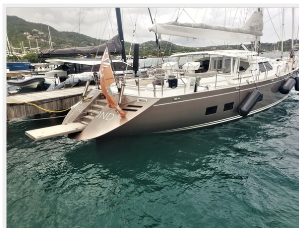
VAGABOND - Transom