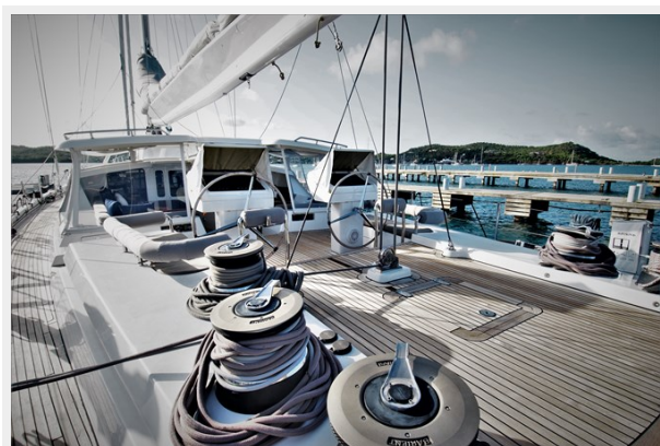
VAGABOND - Aft deck