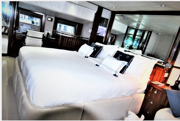
VAGABOND - Master cabin