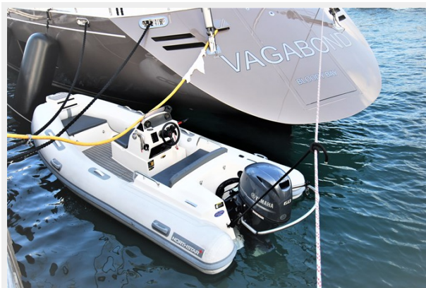
VAGABOND - New tender