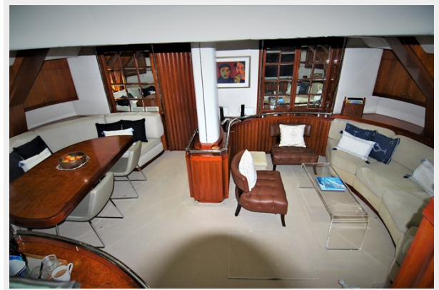
VAGABOND - Salon and dining looking forward