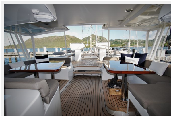
VAGABOND - Cockpit looking aft to steering station