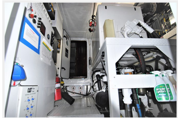
VAGABOND - Port engine room