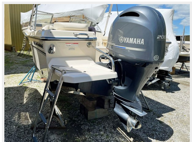
Port Swim Platform w ladder