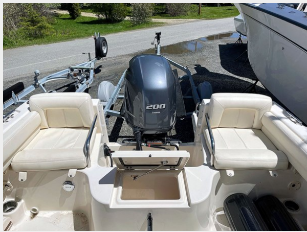
Aft Seats and Cooler