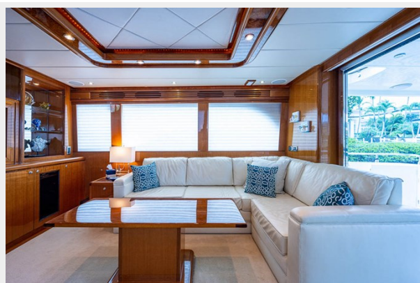
_salon_8 - Copy