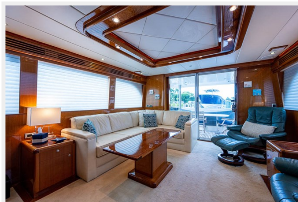
_salon_2 - Copy