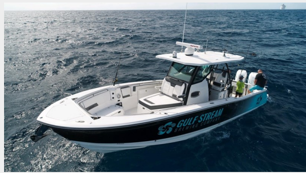
2_2019 33ft Blackfin 332 CC FLOSS'D AT SEA