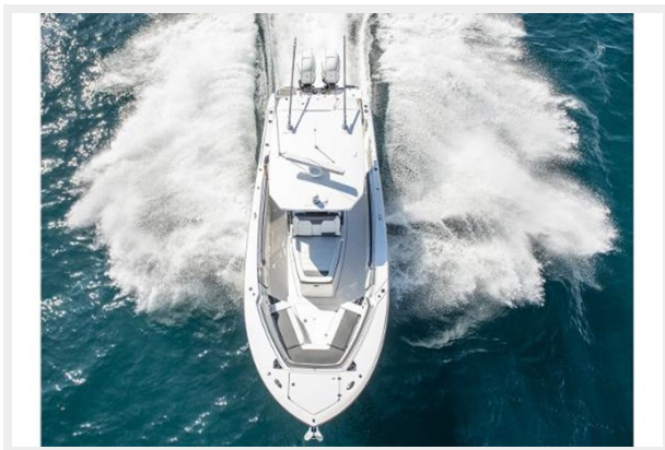
4_2019 33ft Blackfin 332 CC FLOSS'D AT SEA