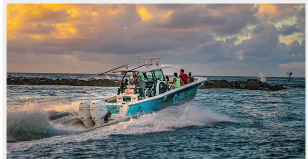
3_2019 33ft Blackfin 332 CC FLOSS'D AT SEA