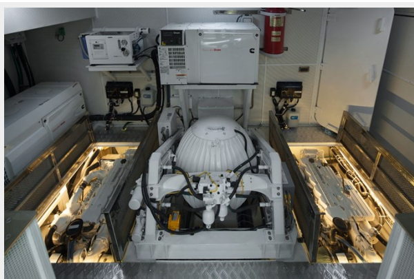
Bering 60 Dzam ER