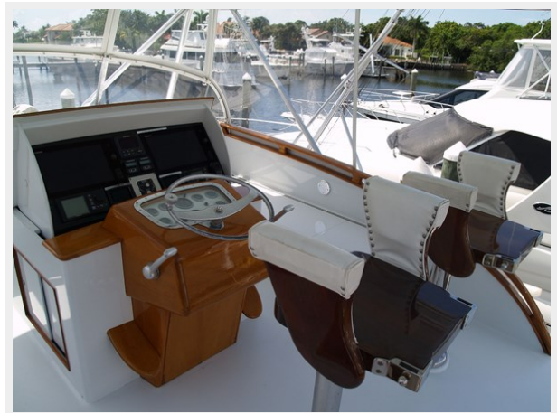
27 Bridge Seating