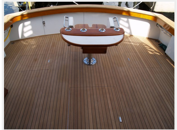
31 Cockpit Aft