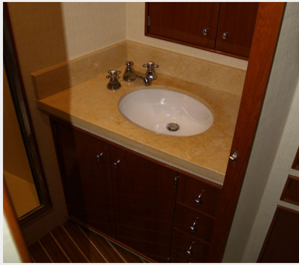
14 Master Head Sink