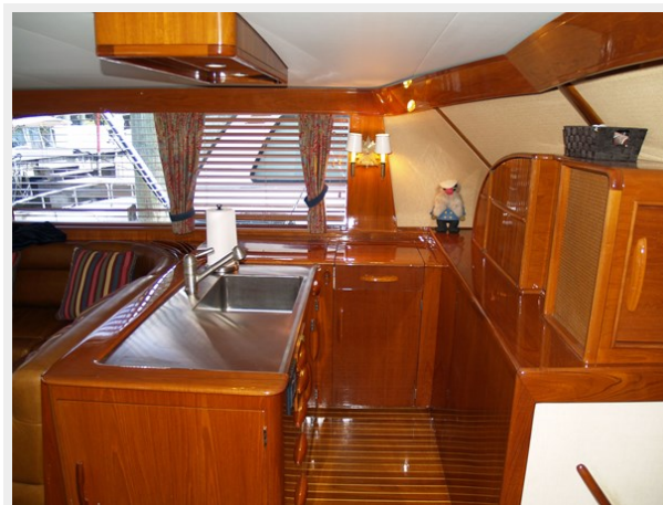
8 Port Side Galley