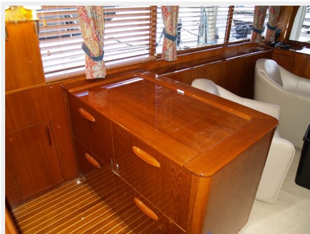
7 Galley Drawer Refrigeration