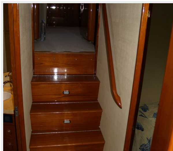
10 Companionway Steps