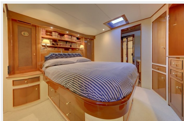
11 Master stateroom 2