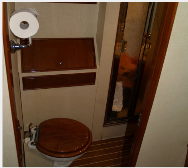
19 Guest Head