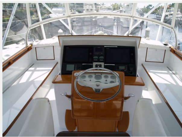
26 Bridge Helm