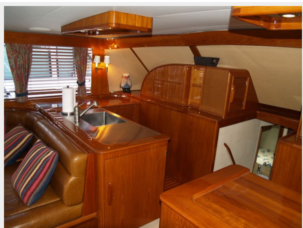
5 Galley Port