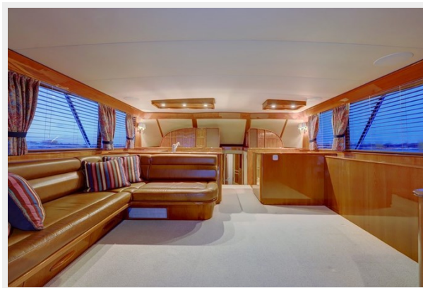
4b Salon Forward