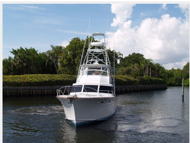
2 Bow View