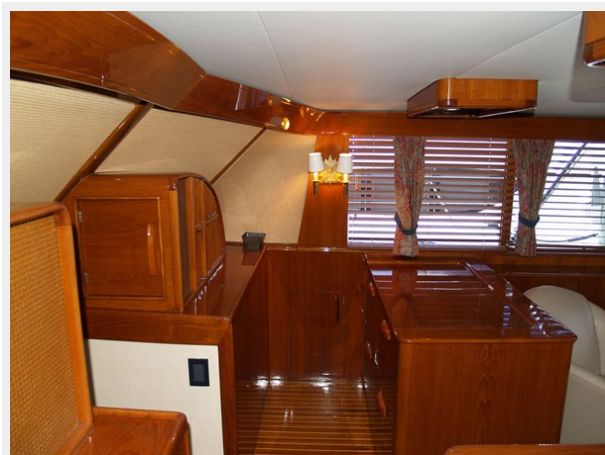
9 Starboard Side Galley