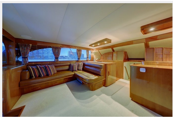
4a Salon Settee