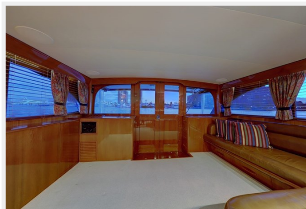
3 Salon Aft