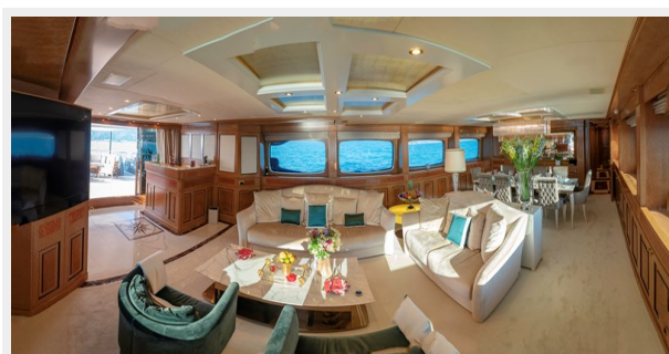
Main deck salon overview