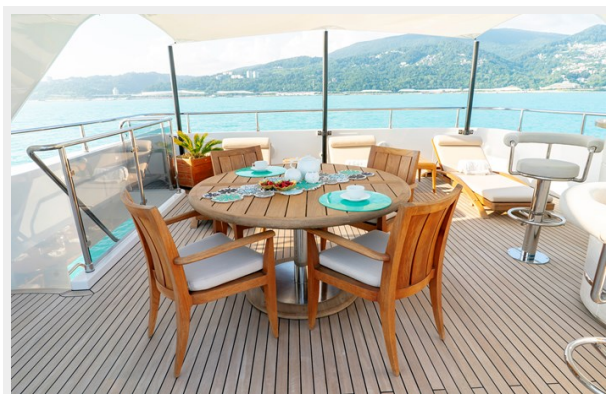
Sun deck dining