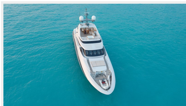
Bow overview Legenda