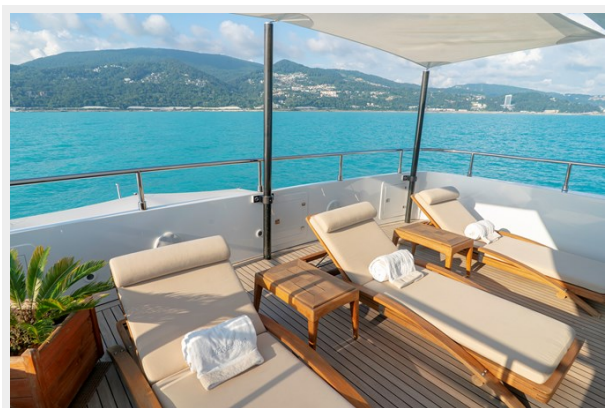
Sun deck sunbeds