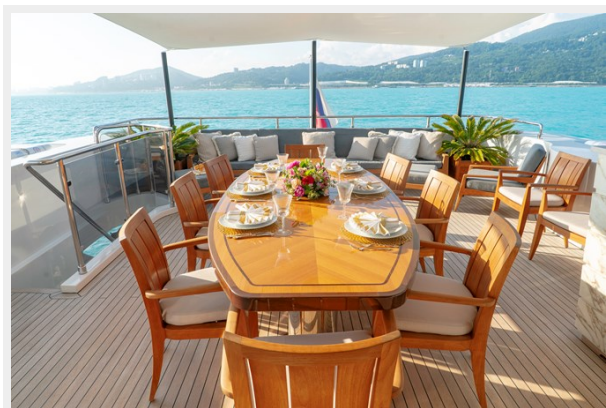
Upper deck dining