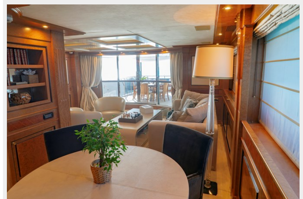
Upper deck salon overview