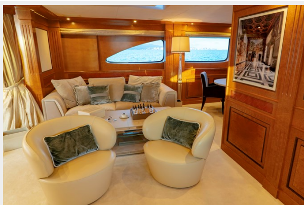
Upper deck salon