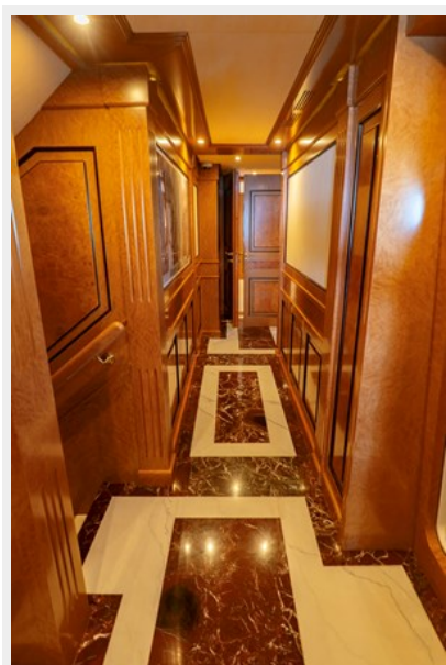
Main deck lobby