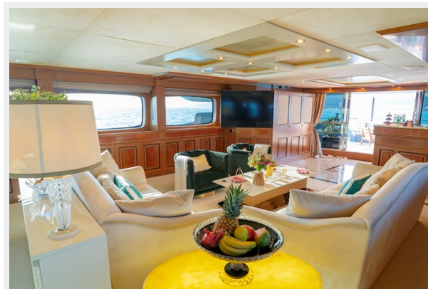
Main deck salon