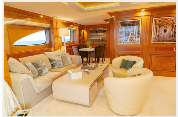
Upper deck salon overview