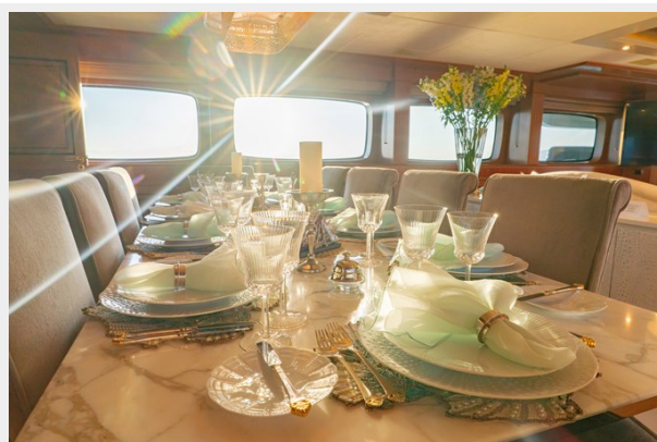
Main deck dining table