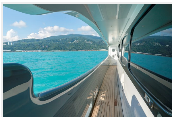
Main deck side passage Legenda