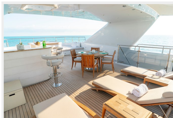
Sun deck overview