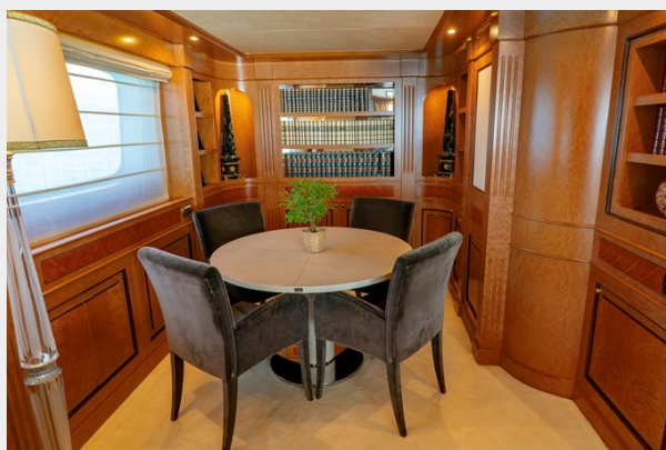
Upper deck game corner