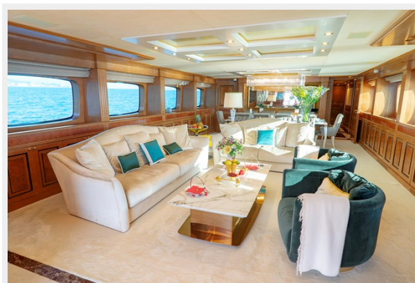
Main deck salon