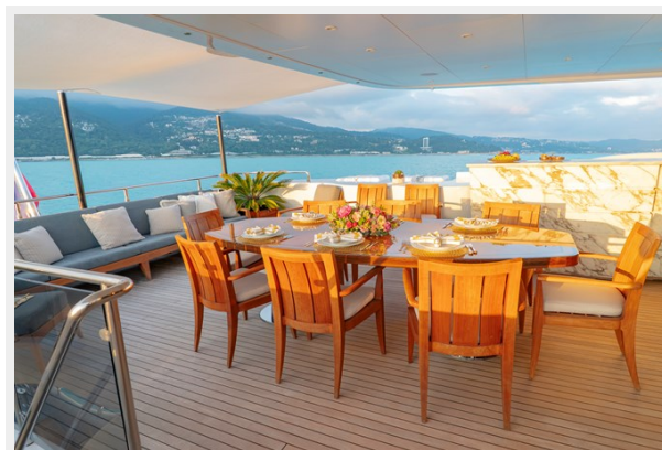
Upper deck dining overview