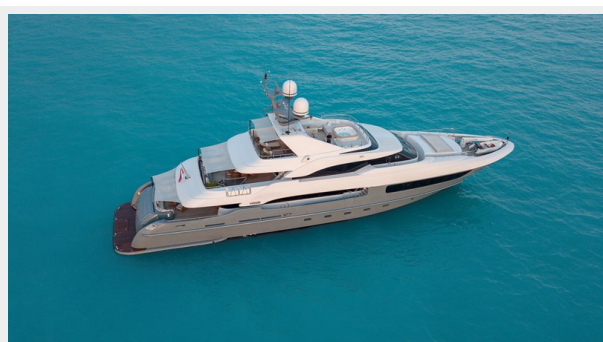
Side overview Legenda