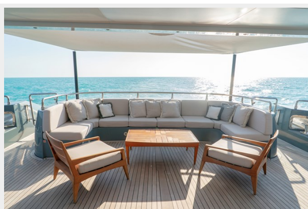
Main deck aft