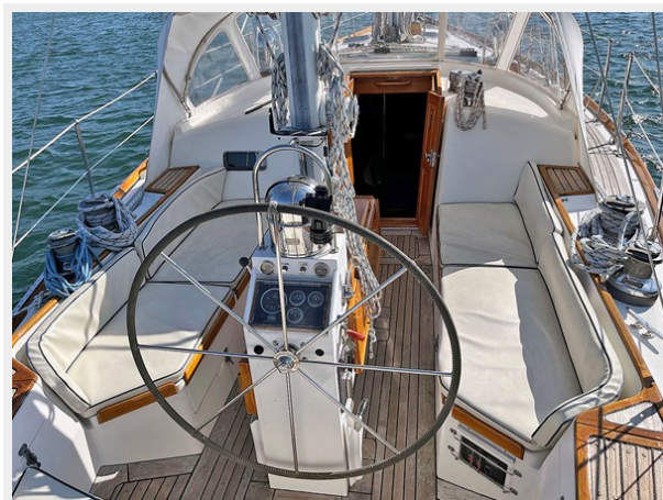
Cockpit, Looking Fwd.