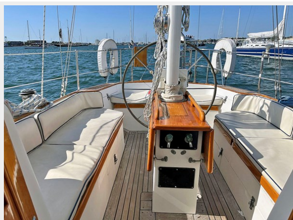
Cockpit, Looking Aft