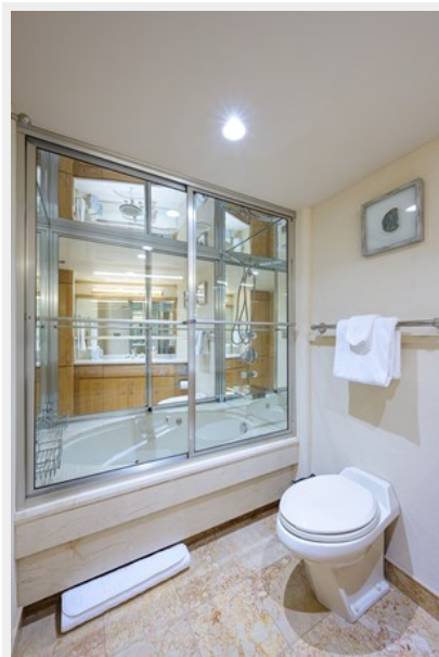
Owner His and Her Ensuite