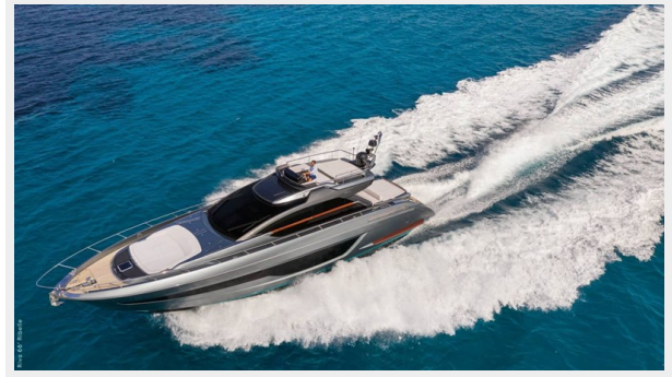
Riva 66 Ribelle 9