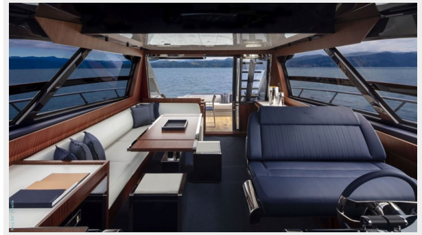
Main deck saloon 1