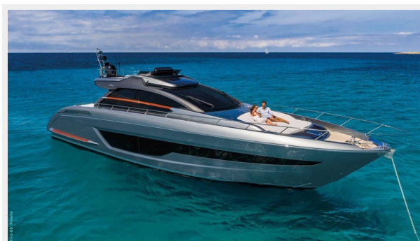
Riva 66 Ribelle 4