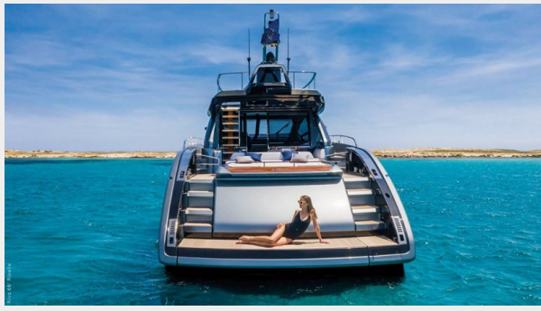
Riva 66 Ribelle