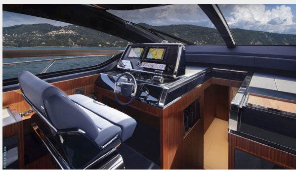
Main deck saloon 5