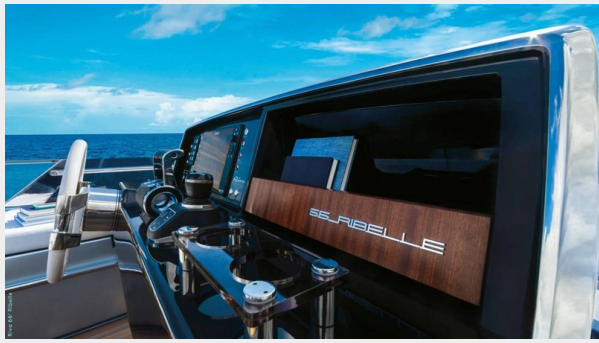
Riva 66 Ribelle 5