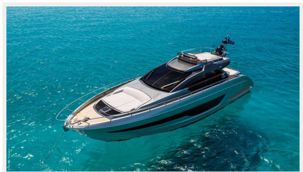
Riva 66 Ribelle 14