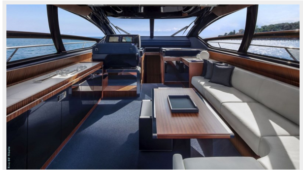
Main deck saloon 4