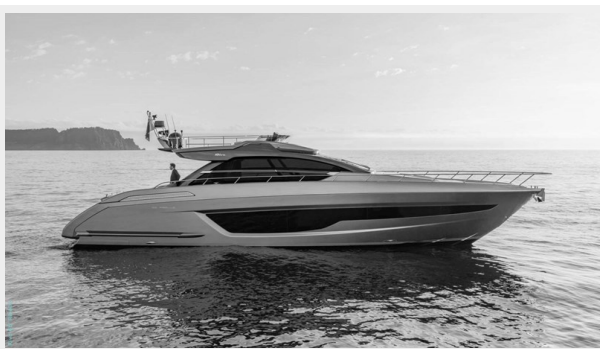
Riva 66 Ribelle 12