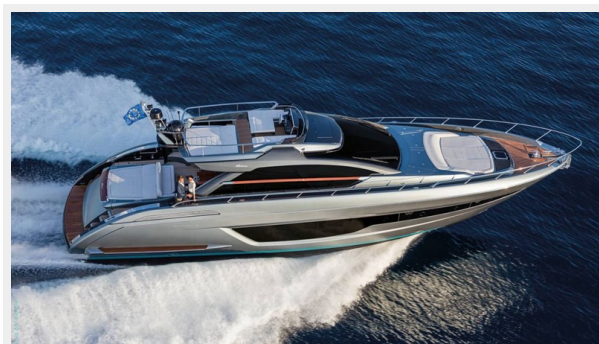
Riva 66 Ribelle