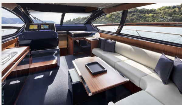
Main deck saloon 2