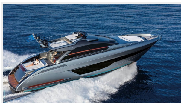
Riva 66 Ribelle 3