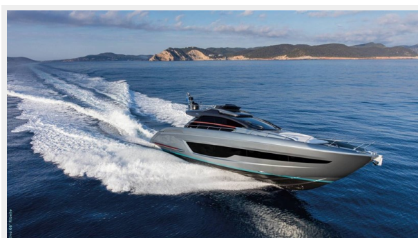
Riva 66 Ribelle 6