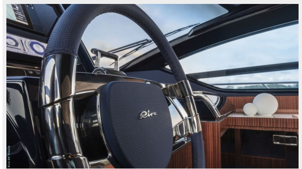
Main deck saloon 3