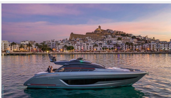
Riva 66 Ribelle 13