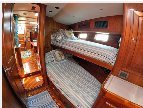
Port Guest Cabin, Looking Aft