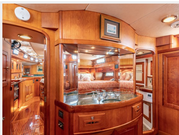
Owner's Cabin, Looking Fwd.