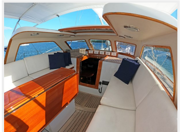
Cockpit Fwd., Hard Dodger with Moon Roof Open