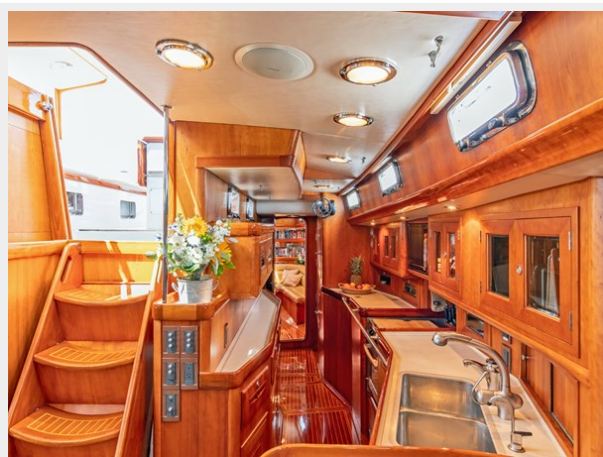
Galley, Looking Aft