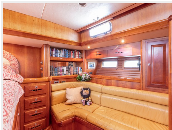
Owner's Cabin, Port