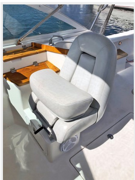
Helm Seat Bolster Up