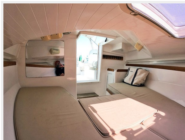
Interior Looking Aft