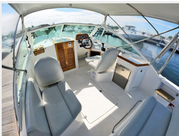
Additional Seating and Wetbar