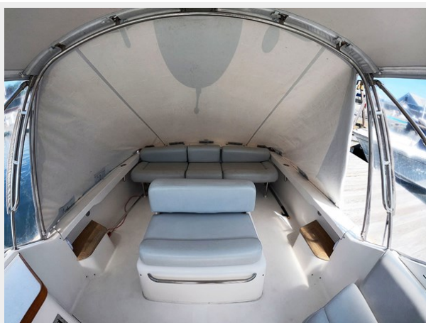
Cockpit Cover from Inside