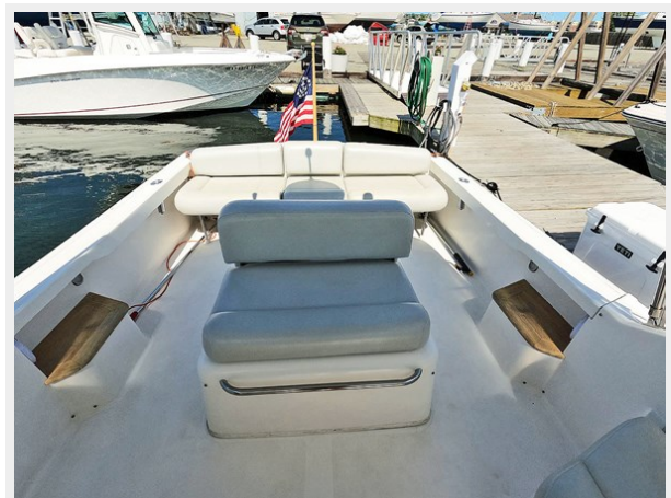
Cockpit Looking Aft