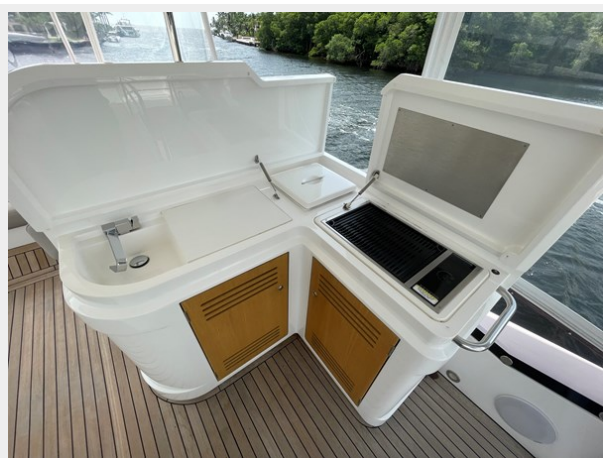
JPEG image 41