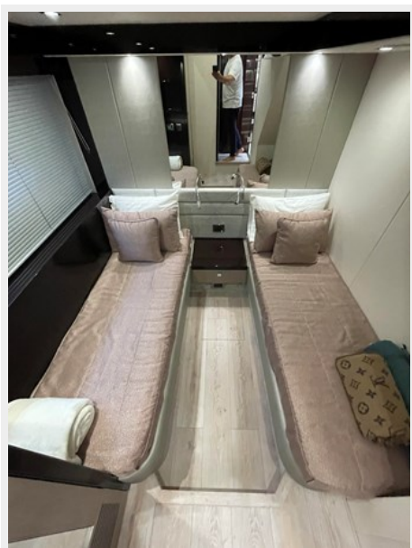
JPEG image 3