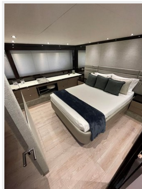
JPEG image 14