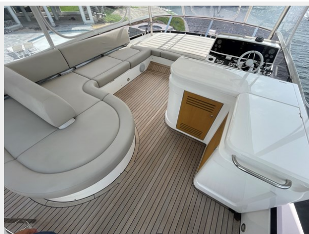
JPEG image 36