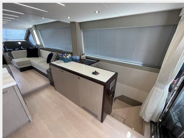
JPEG image 13