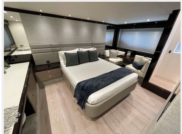
JPEG image 17