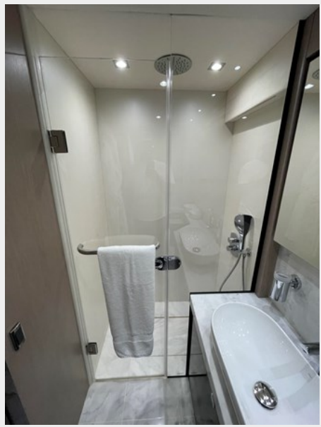
JPEG image 16