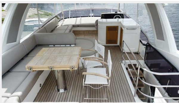
JPEG image 21