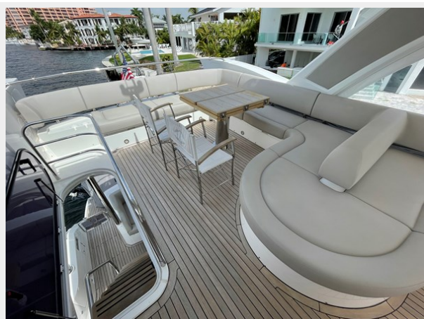
JPEG image 39