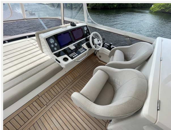
JPEG image 37