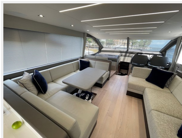
JPEG image 9