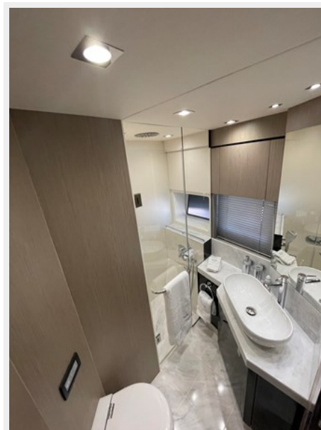
JPEG image 2