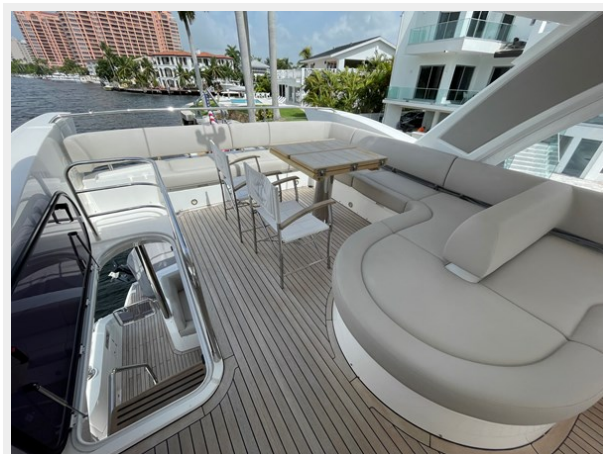
JPEG image 40