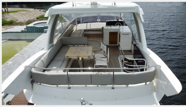
JPEG image 20