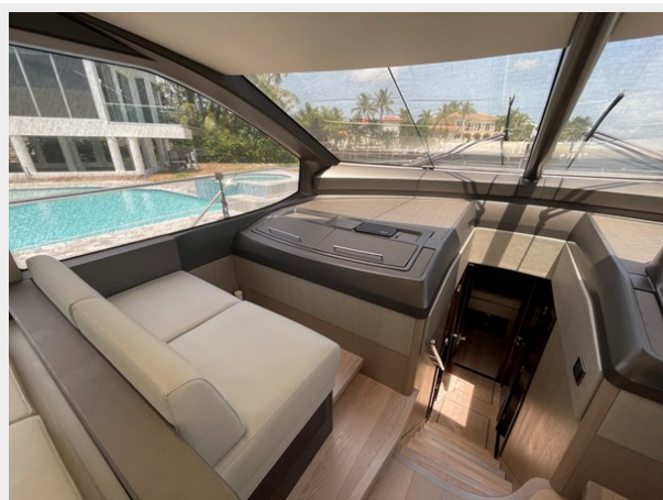
JPEG image 8