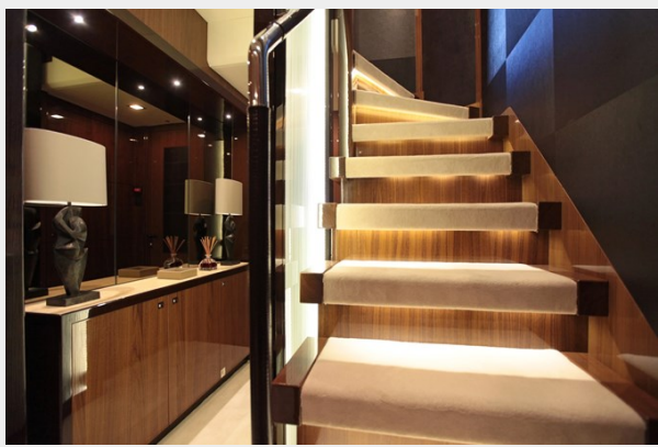
WhatsApp Image 2022-08-18 at 11.19.07