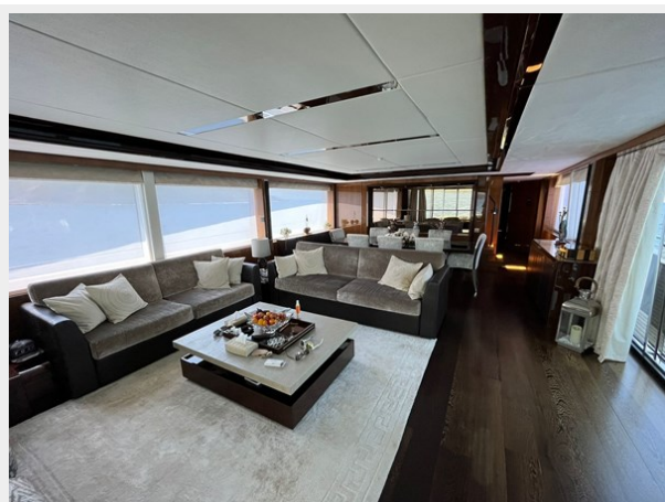
WhatsApp Image 2022-08-18 at 11.19.23 (1)