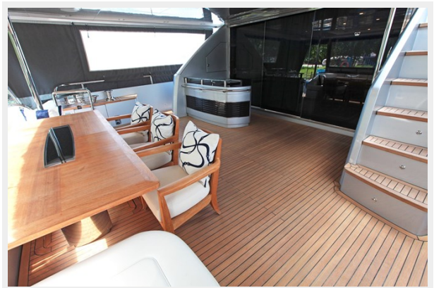
WhatsApp Image 2022-08-18 at 11.19.22