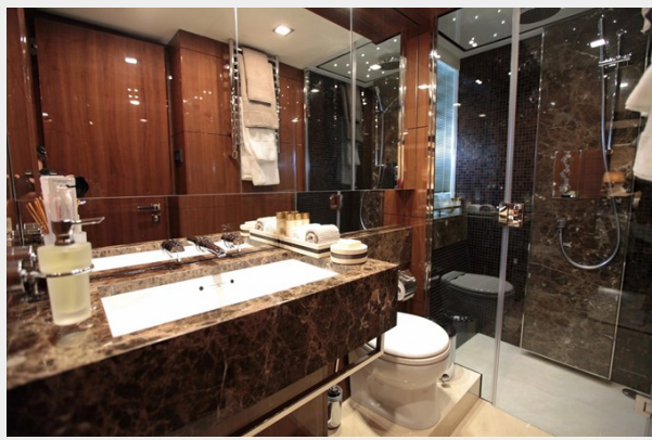
WhatsApp Image 2022-08-18 at 11.19.03 (1)