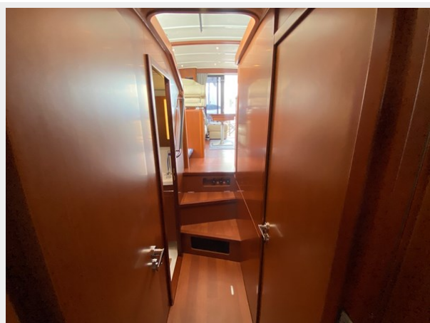
2019 ST 44 - 37