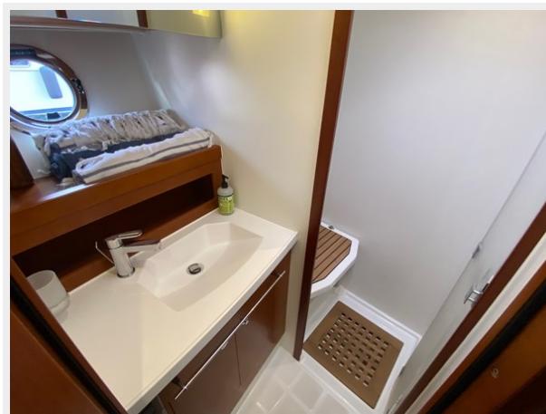
2019 ST 44 - 36