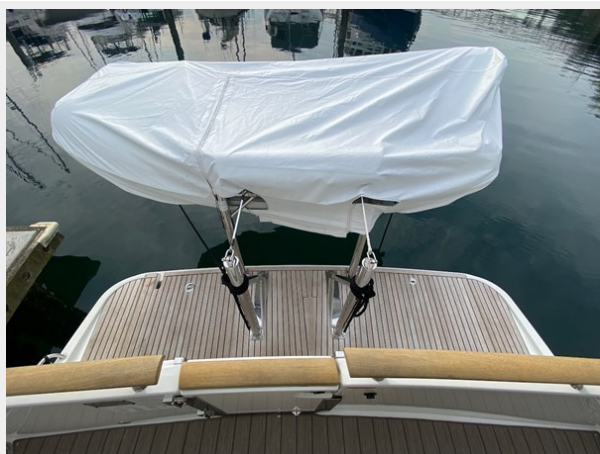
2019 ST 44 - 43