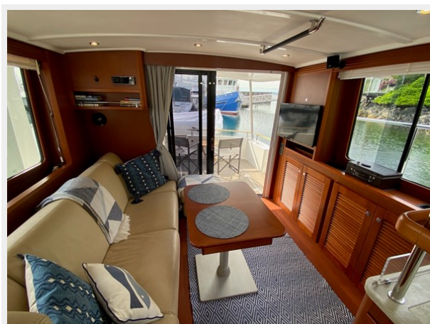
2019 ST 44 - 27