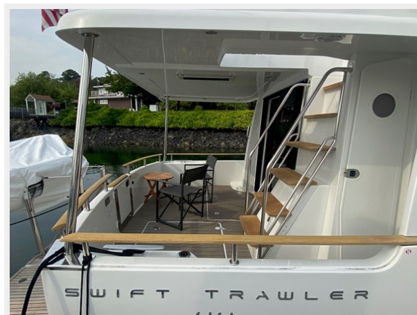
2019 ST 44 - 11