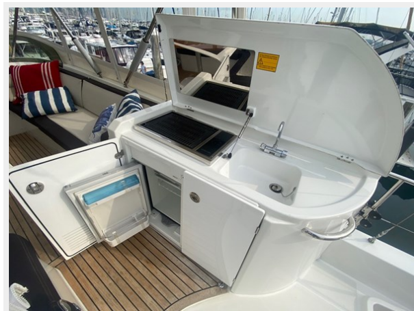
2019 ST 44 - 23