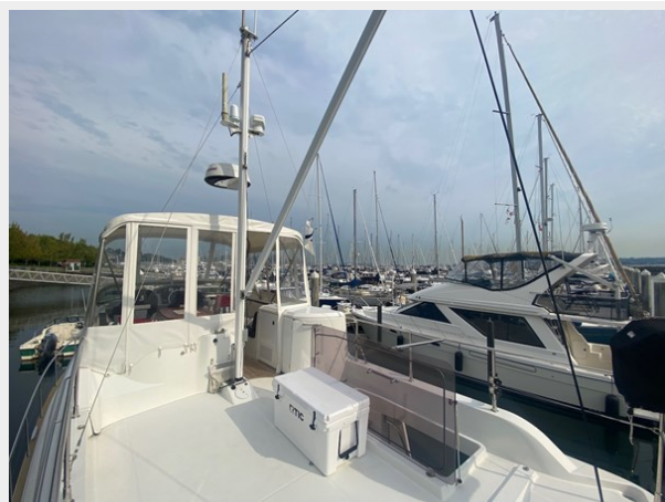
2019 ST 44 - 17