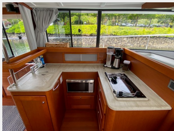
2019 ST 44 - 29