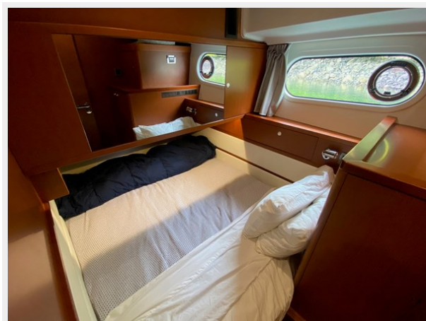
2019 ST 44 - 38