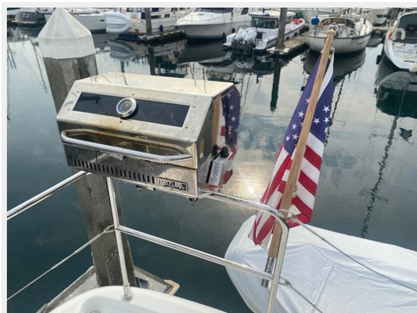
2019 ST 44 - 24