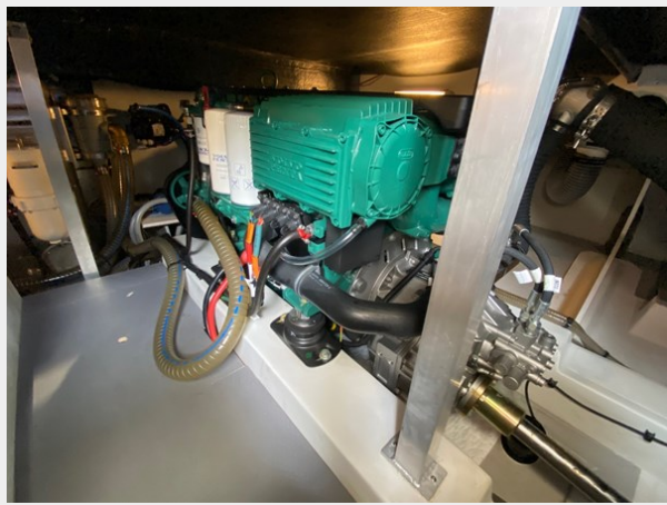
2019 ST 44 - 41