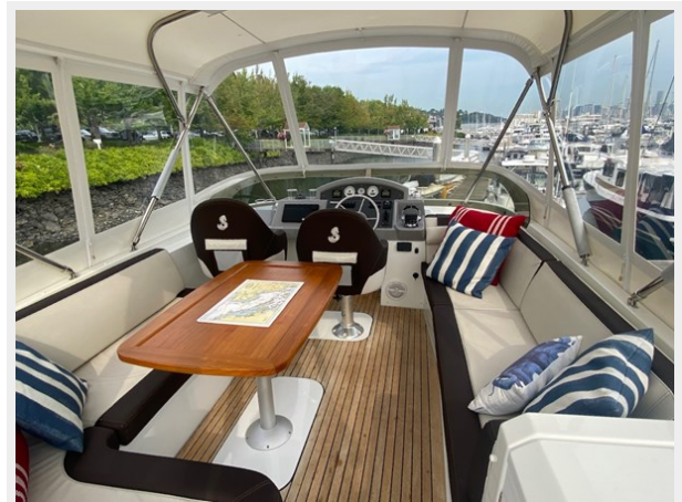
2019 ST 44 - 18