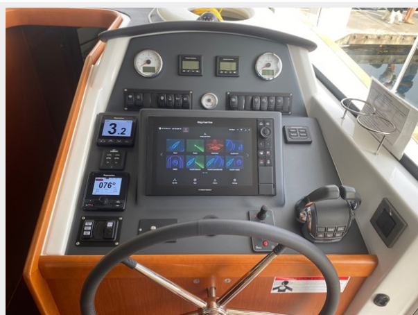
2019 ST 44 - 31