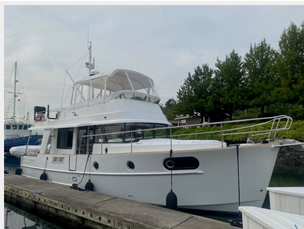
2019 ST 44 - 1