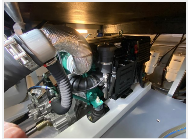
2019 ST 44 - 42