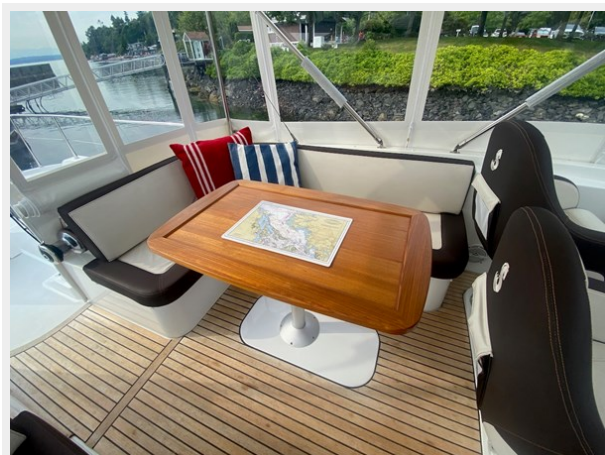
2019 ST 44 - 22