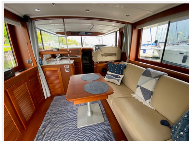
2019 ST 44 - 26