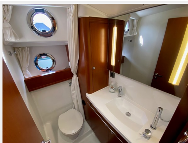
2019 ST 44 - 39