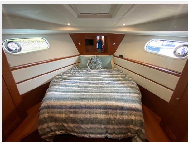
2019 ST 44 - 33