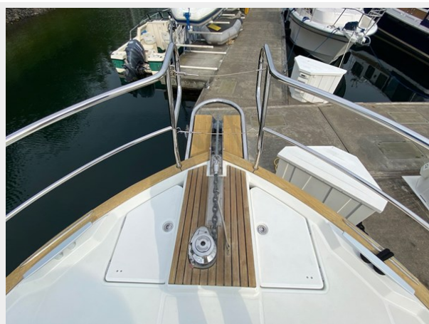
2019 ST 44 - 5