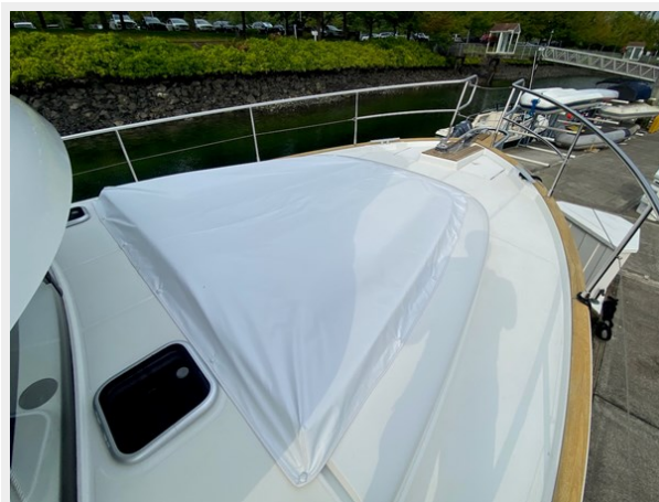
2019 ST 44 - 4