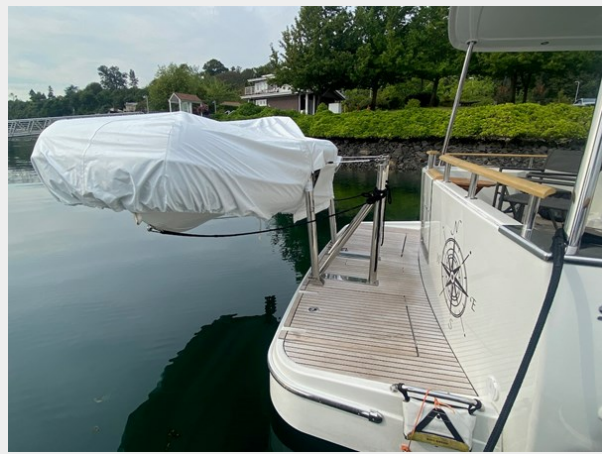
2019 ST 44 - 15