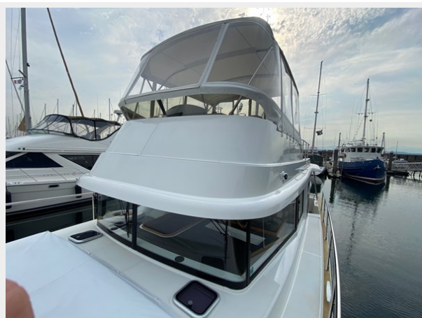
2019 ST 44 - 7