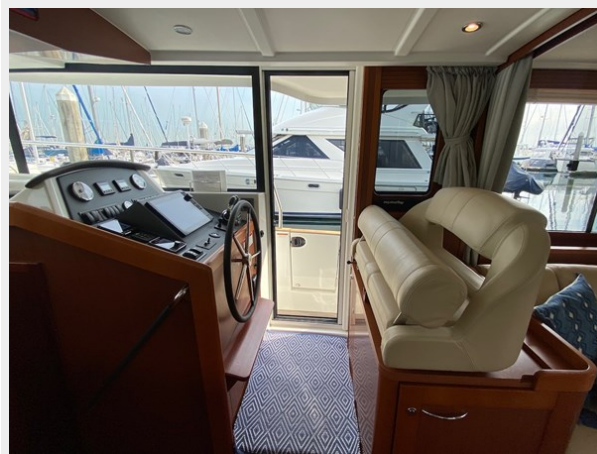
2019 ST 44 - 30