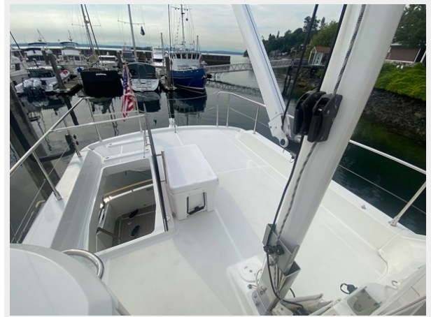
2019 ST 44 - 16