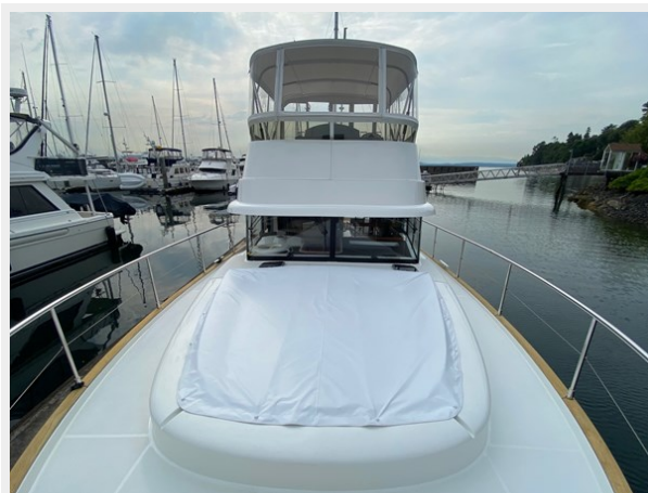
2019 ST 44 - 6