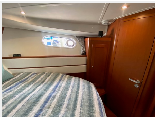
2019 ST 44 - 35