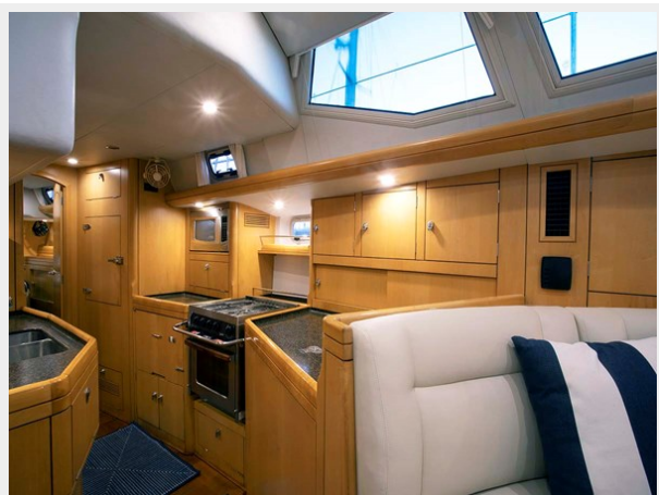
Galley, Looking Aft