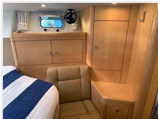
VIP Cabin, Stbd.