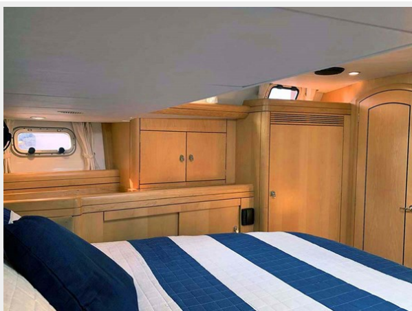
Owner's Cabin, Port