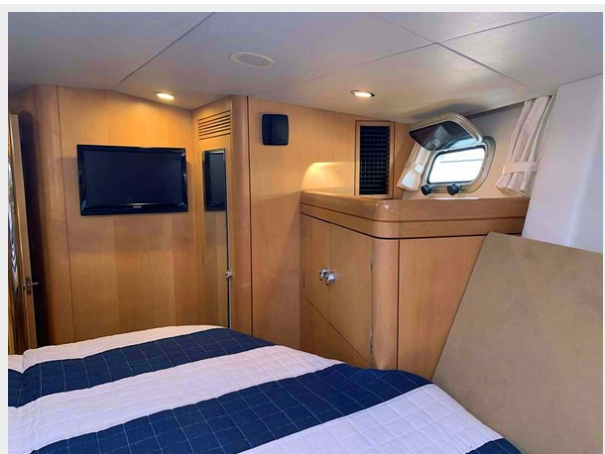
VIP Cabin, Port Aft