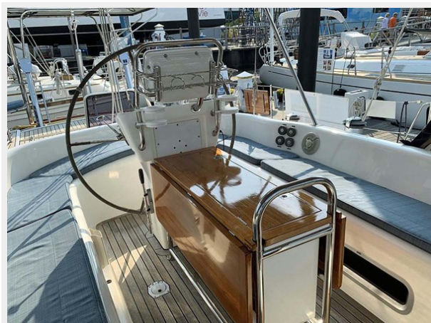
Cockpit Looking Aft