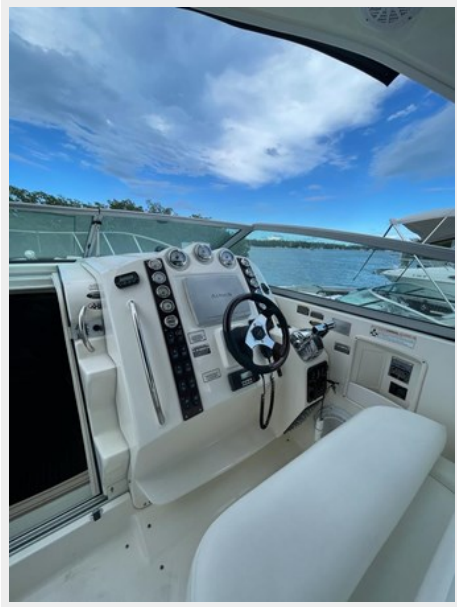
WhatsApp Image 2022-08-24 at 3.10.12 PM (6)