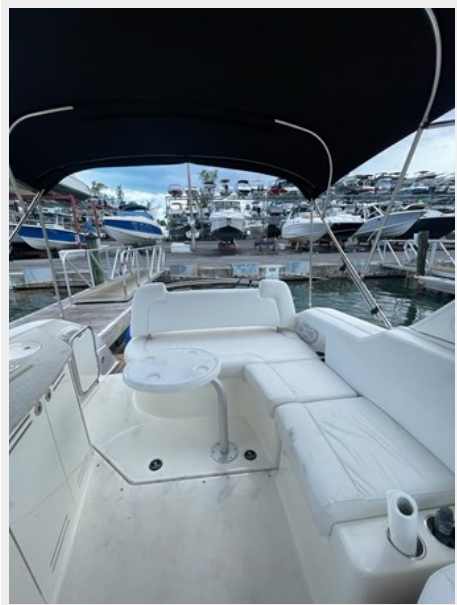
WhatsApp Image 2022-08-24 at 3.10.12 PM (8)