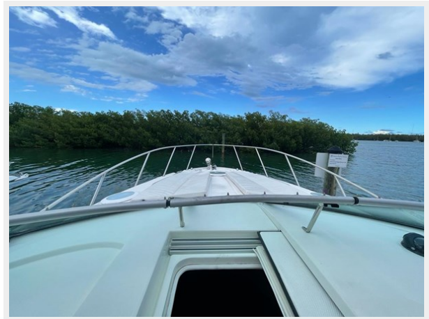
WhatsApp Image 2022-08-24 at 3.10.12 PM (7)