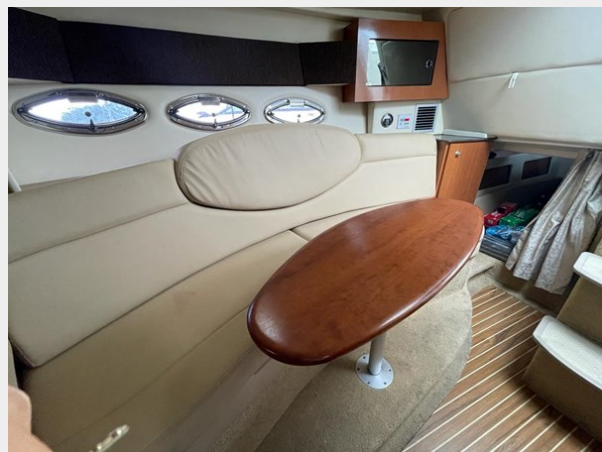
WhatsApp Image 2022-08-24 at 3.10.12 PM (2)