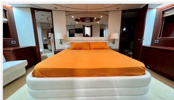
2004 Posillipo Technema 80 - Master Cabin