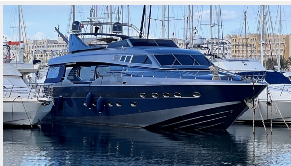
2004 Posillipo Technema 80 - Front Stb Side View