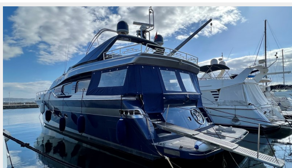
2004 Posillipo Technema 80 - Aft Port Side View