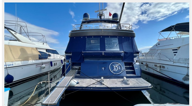
2004 Posillipo Technema 80 - Stern View