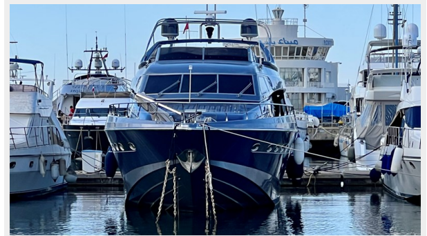
2004 Posillipo Technema 80 - Front View