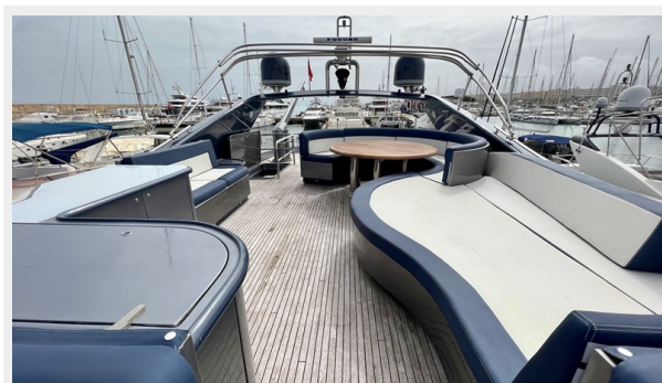
2004 Posillipo Technema 80 - Flybridge looking Aft