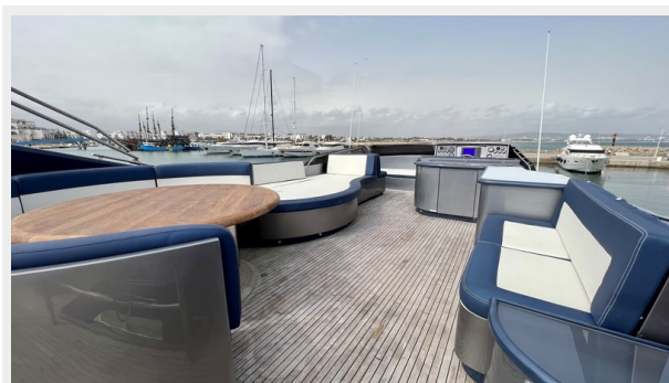
2004 Posillipo Technema 80 - Flybridge Looking Fwd