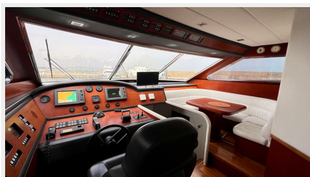
2004 Posillipo Technema 80 - Wheel House