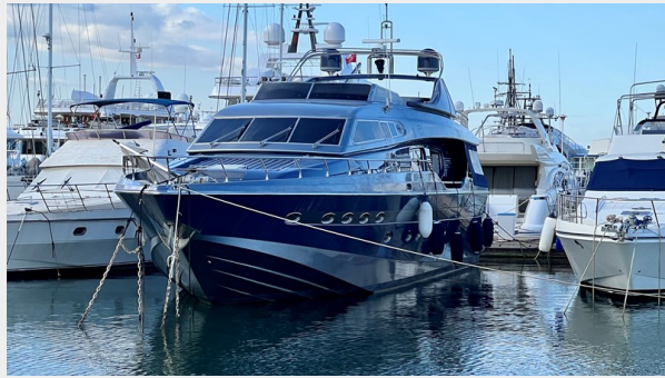
2004 Posillipo Technema 80 - Front Port Side View