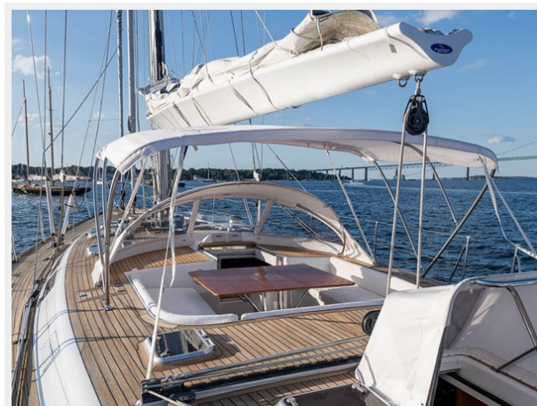
Dodger and Bimini