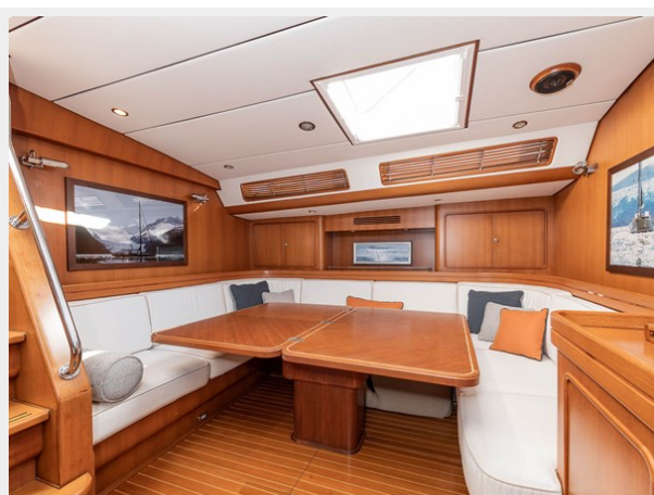
Port Salon Settee