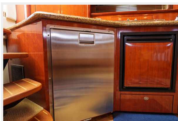
Dometic refrigerator and freezer