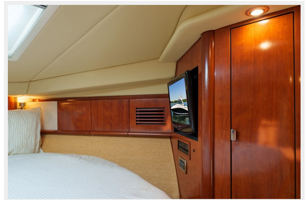
Entertainment center in the master stateroom