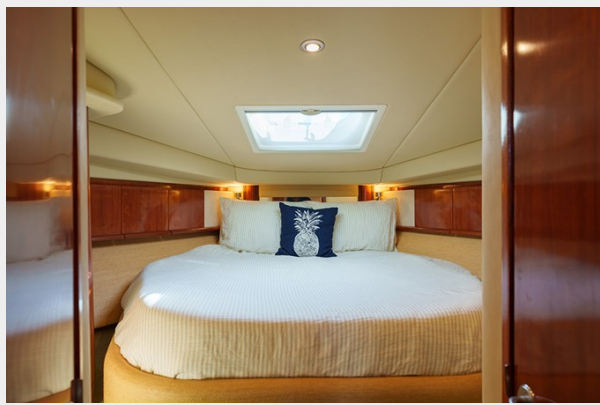
Master stateroom view 2