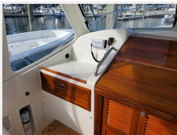
Port Side Dash