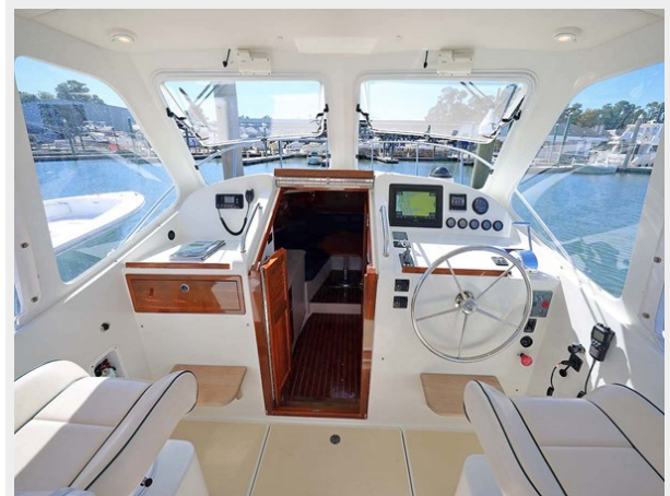
Helm and Nav Pod to Port