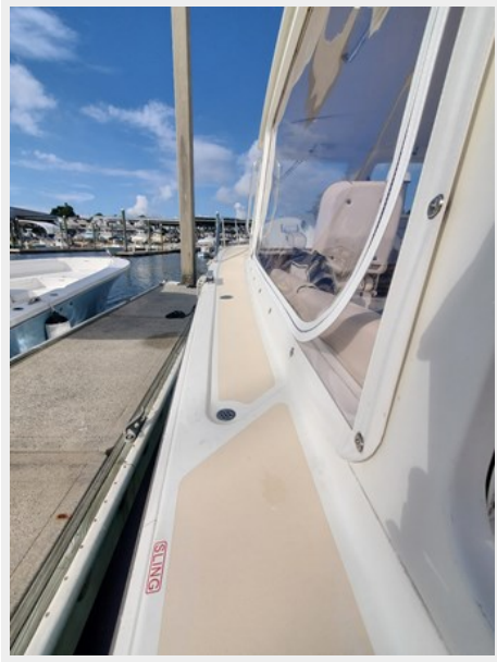
Port Side Deck Detail