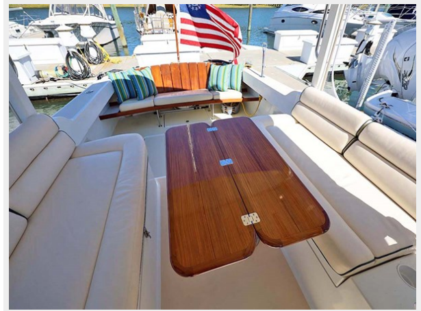
Bridgedeck Table Open