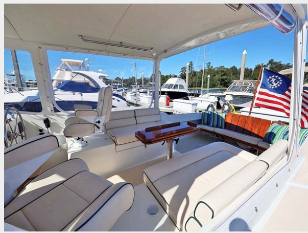
Bridgedeck Aft to Starboard