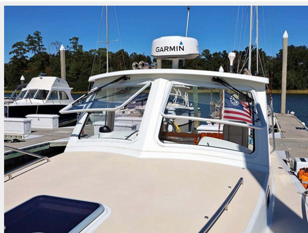
Front Opening Windshield Panels