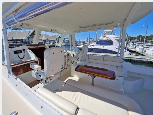
Bridgedeck Looking to Starboard