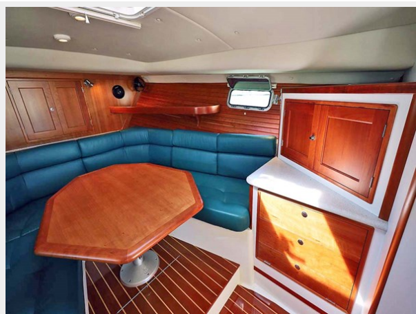
Interior to Starboard