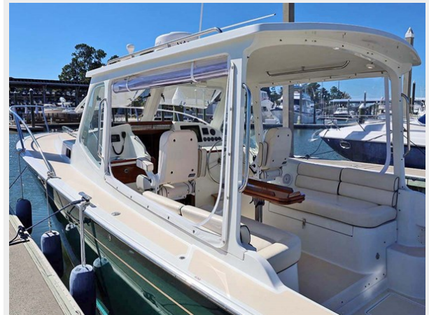
Bridgedeck and Hardtop