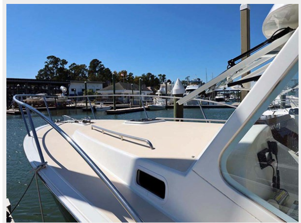
Cabin Trunk and Windshield