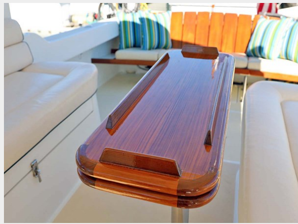
Bridgedeck Table Detail