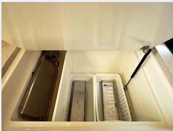
Reefer and Freezer