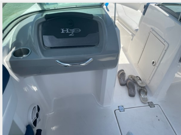
06-PORT SIDE CONSOLE