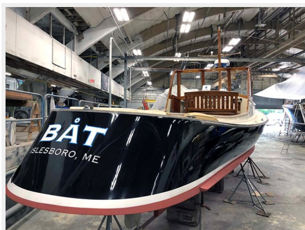
Sheer Line, Stbd. side