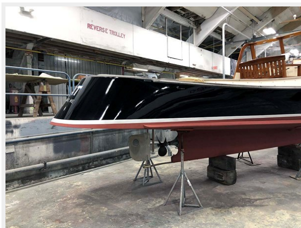
Aft Qtr., Hauled Out