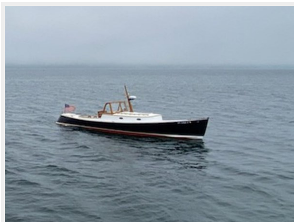
Stbd. Bow in Water