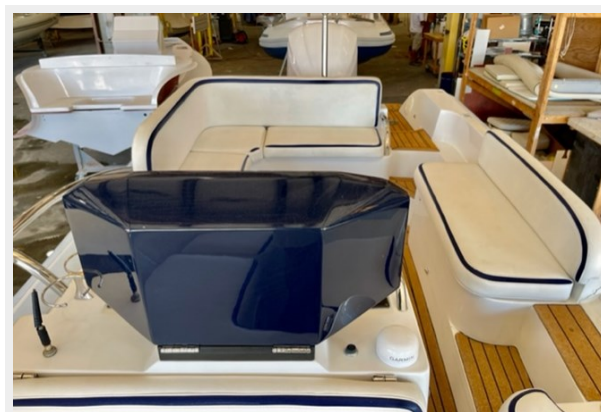
Aft Seating 1