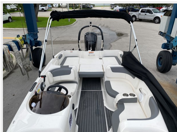
12-COCKPIT RUBBER FLOORING