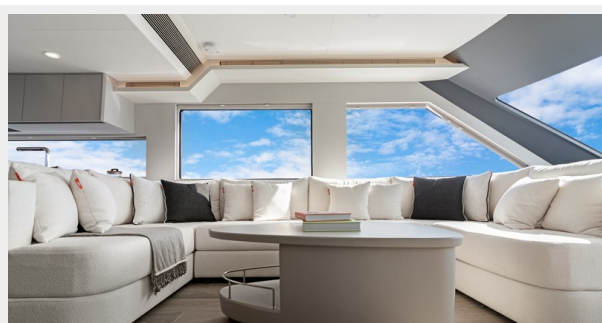
HD-Cheoy Lee 65-62