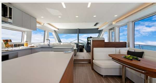
HD-Cheoy Lee 65-46