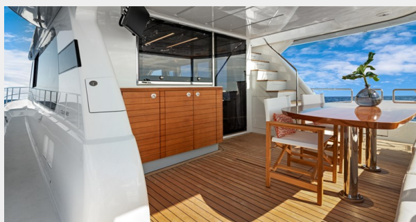
HD-Cheoy Lee 65-33