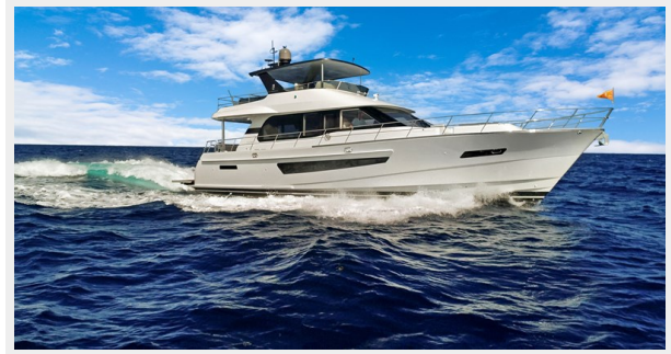
HD-Cheoy Lee 65-runningstbd3