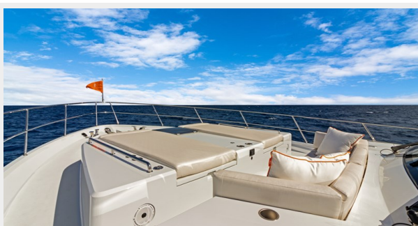
HD-Cheoy Lee 65-25