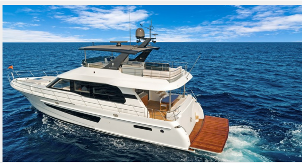
HD-Cheoy Lee 65-21