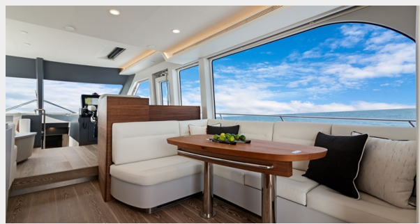
HD-Cheoy Lee 65-47