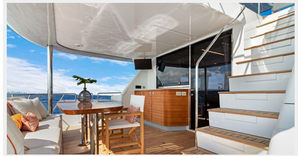
HD-Cheoy Lee 65-32