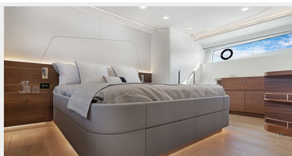
HD-Cheoy Lee 65-master4