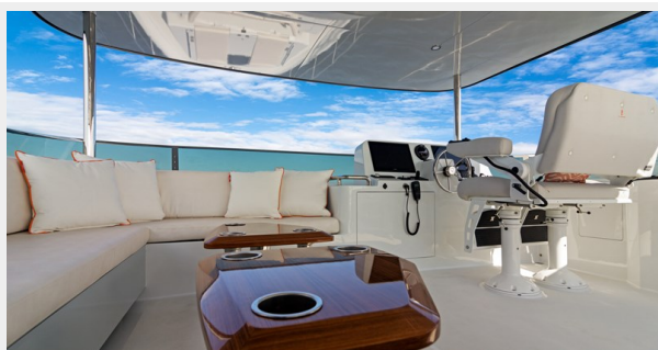
HD-Cheoy Lee 65-35