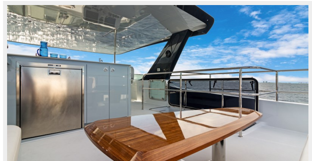
HD-Cheoy Lee 65-43