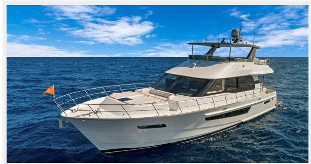
HD-Cheoy Lee 65-23