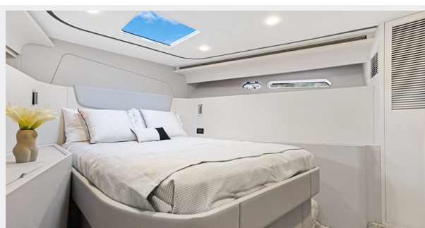
HD-Cheoy Lee 65-52