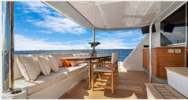
HD-Cheoy Lee 65-31