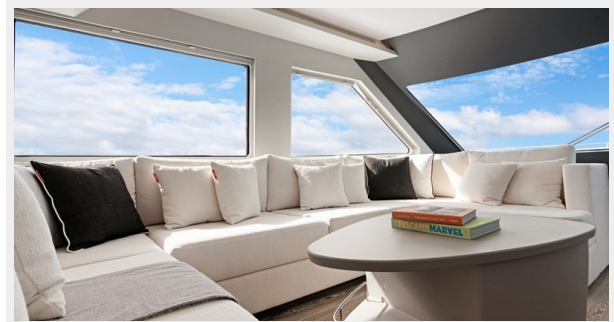
HD-Cheoy Lee 65-56