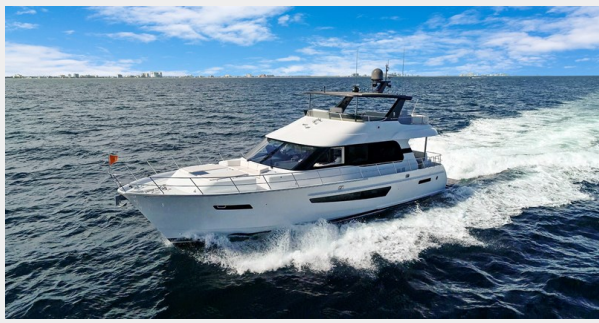
HD-Cheoy Lee 65-runningportbow