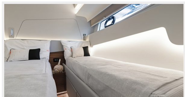
HD-Cheoy Lee 65-68