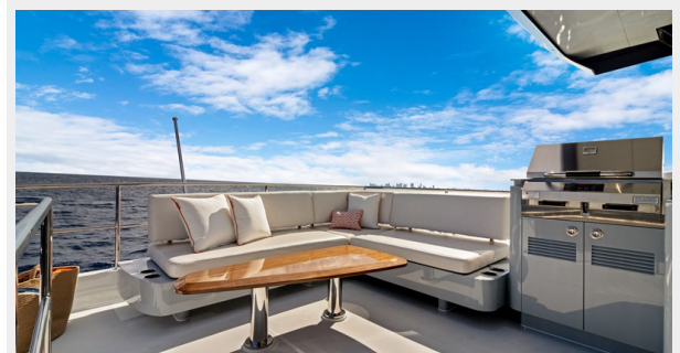
HD-Cheoy Lee 65-36(1)