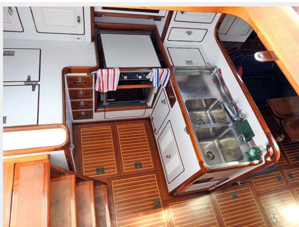
Galley, from Above