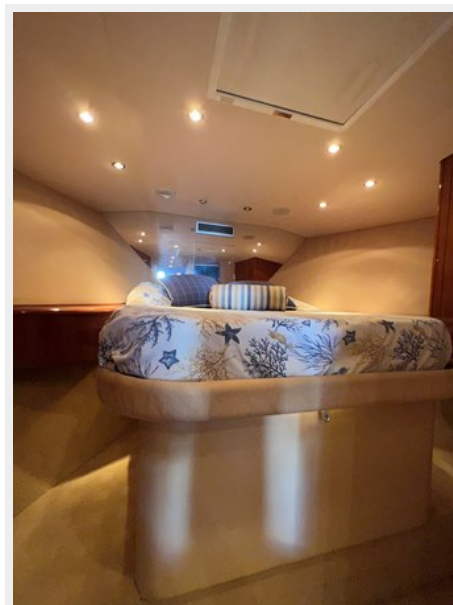
Owner stateroom 1