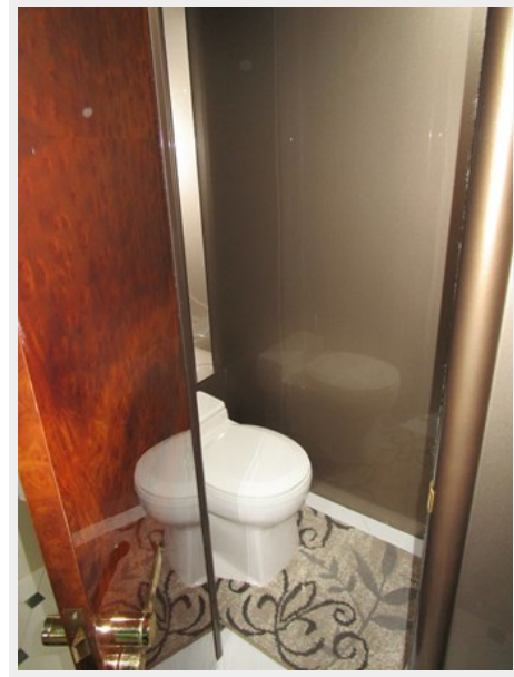
Private Toilet Room