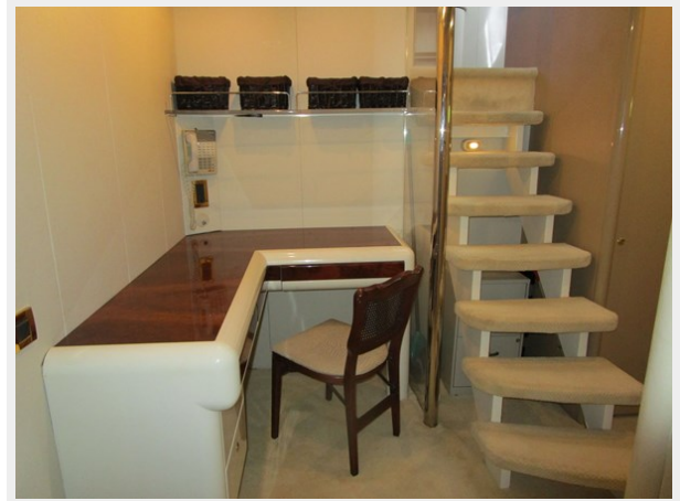
Office Area Forward forward