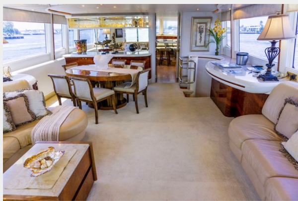
Salon Looking Forward