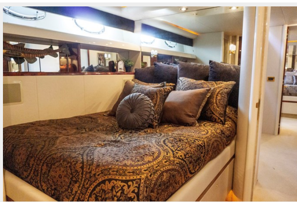
Stbd Side Cabin