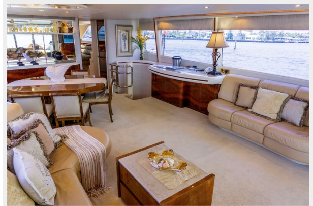
Salon Looking to Stbd