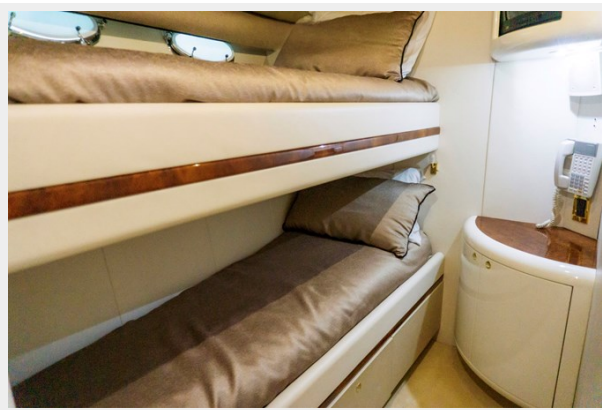
Forward Guest Room