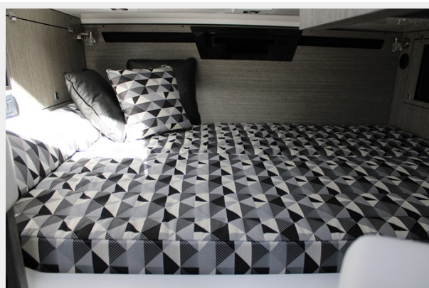
Queen Berth to Starboard