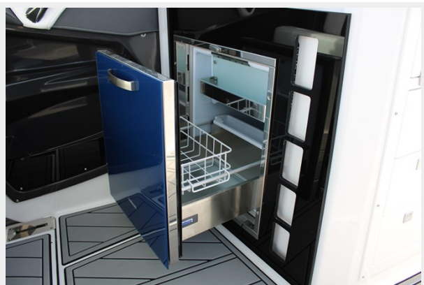
Cockpit Fridge Open