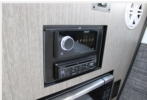
Fusion Apollo Control Head