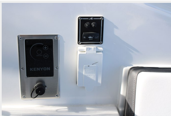
Cockpit Shade & Electric Grill Controls