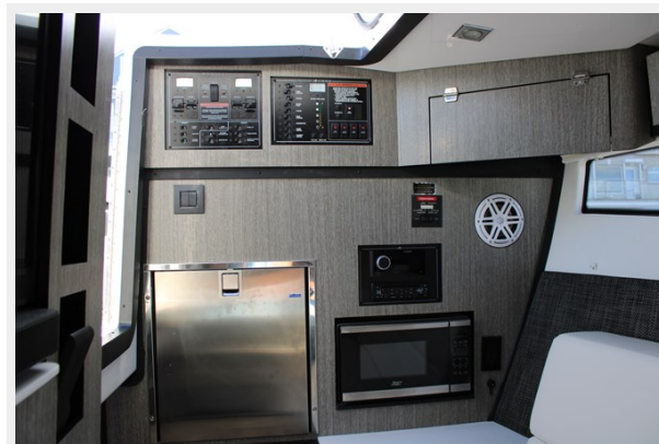
Forward Bulkhead in Cabin