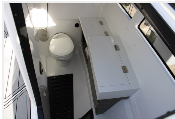
Head to Port