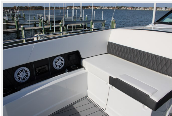
Bow Seating Area