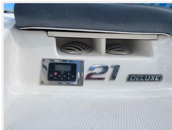
14-SOUND SYSTEM REMOTE AT STERN