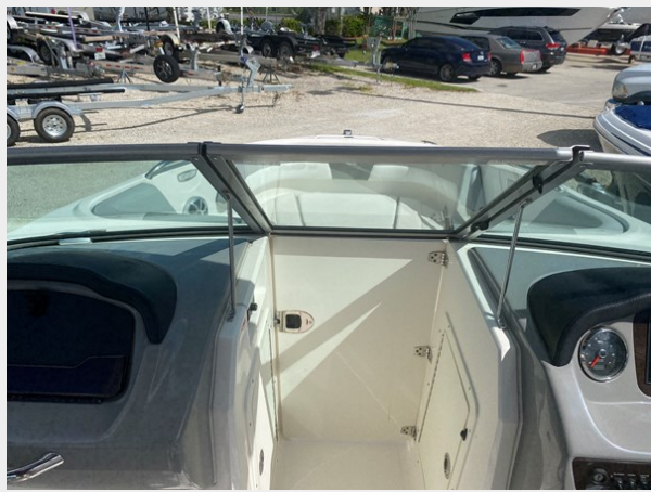
08-BOW WALK THRU DOOR