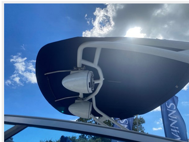
15-SPEAKERS @SPORT ARCH