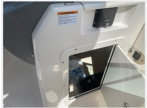
09-UNDERDASH STORAGE PORT