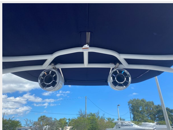
15-SPEAKERS @ SPORT ARCH