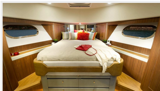
54 Belize Sedan 8