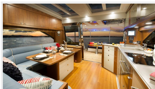
54 Belize Sedan 5