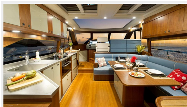
54 Belize Sedan4