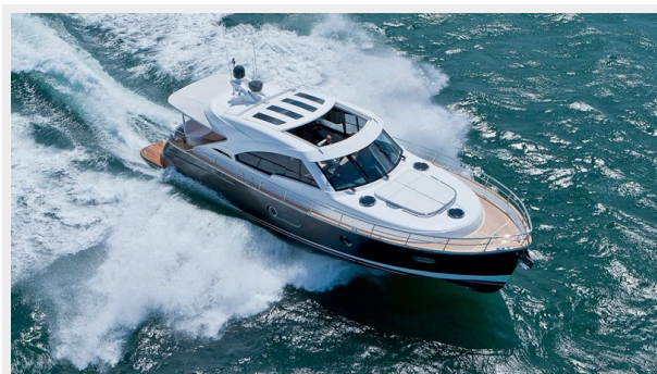
54 Belize Sedan2