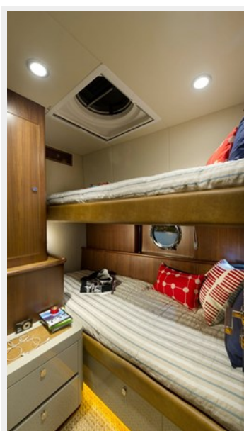
54 Belize Sedan 11