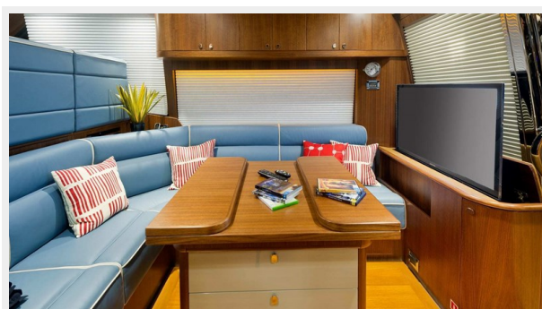
54 Belize Sedan 6