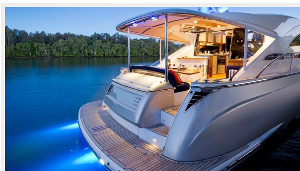
54 Belize Sedan 3