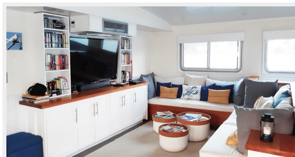
Salon with TV (4608 x 2128) -edit (2)