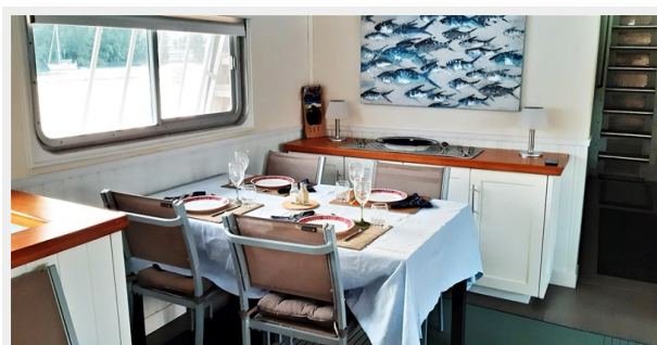
Salon Dining set for four (4608 x 2128) -edit (1)