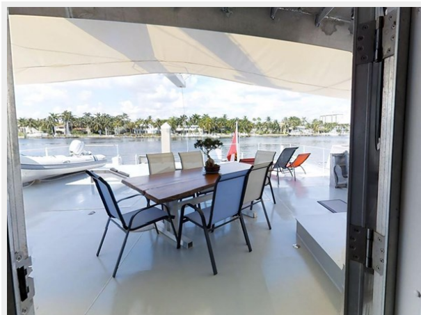
Aft Deck Lunch (1201 x 895) (1)