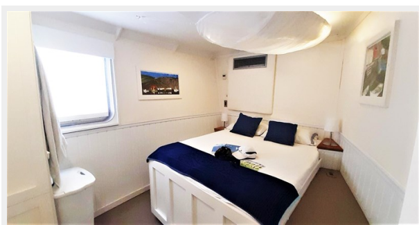
MBR 1 (2576 x 1188)-edit (1)