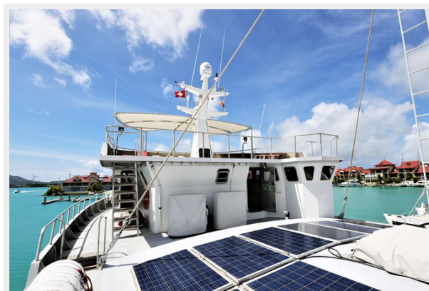
Solar panels to flybridge (5760 x 3840) (2)