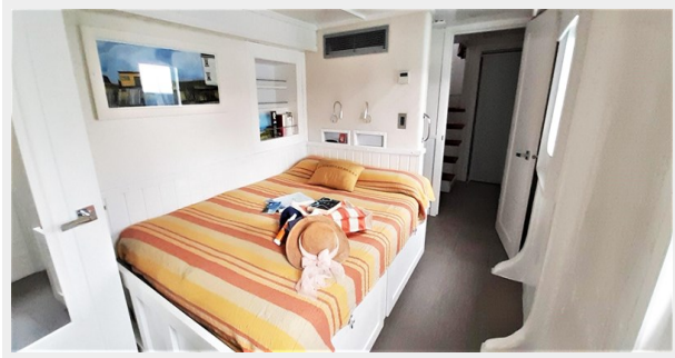
Lower Cabin 1, Port (2576 x 1188), edit (1)