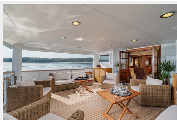
5 - Main Deck Aft