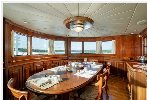
11 - Main Deck Fwd Dining