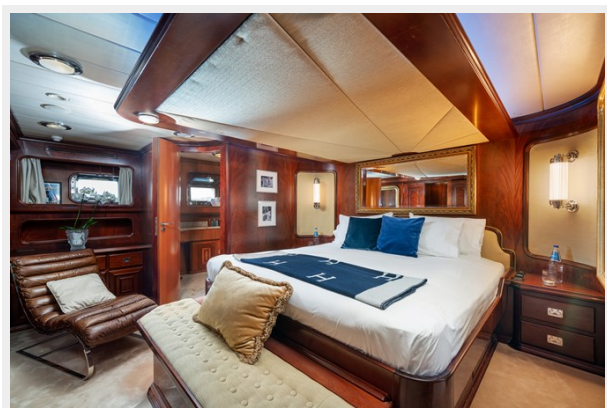
12 - Owner Cabin