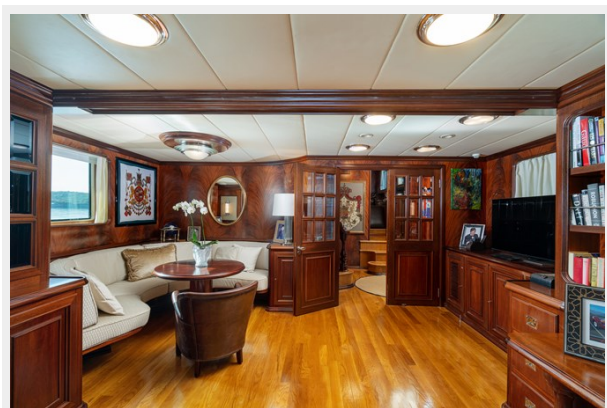
10 - Main Saloon Lounge