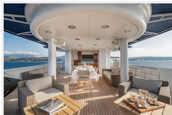
17 - Upper Deck Dining