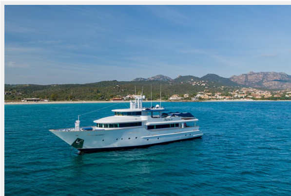
3 - Profile