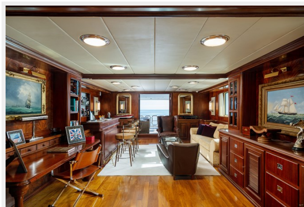
9 - Main Saloon Wide