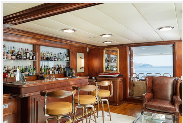
8 - Main Saloon Bar