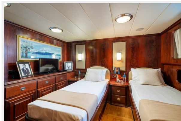
15 - Twin STB