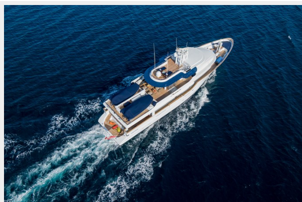
2 - Aerial