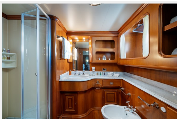
16 - Twin Bathroom