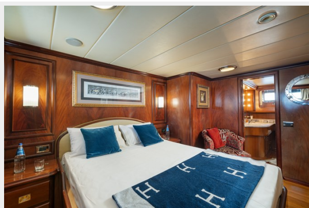
14 - Vip Cabin