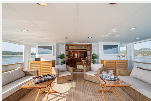
6 - Main Deck Aft Wide