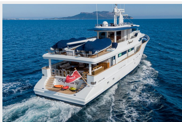
4 - Stern View