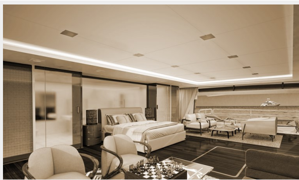
GSD detail (12)_Sepia