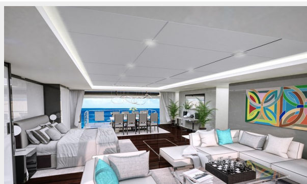
GSD detail (9)