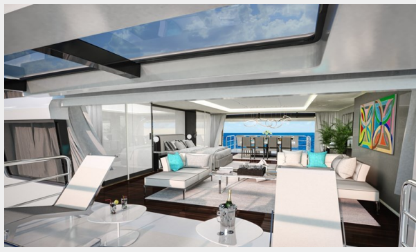
GSD detail (11)