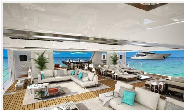
GSD detail (6)