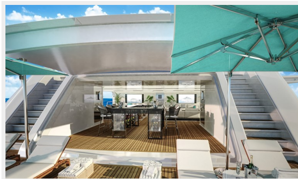
GSD detail (8)