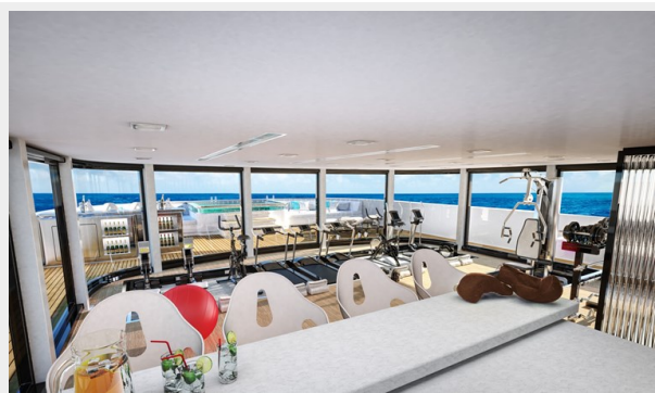
GSD detail (3)