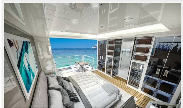
GSD detail (16)