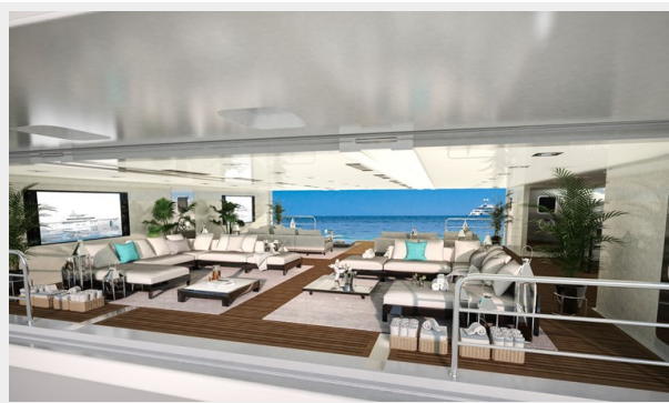
GSD detail (7)