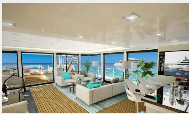
GSD detail (22)