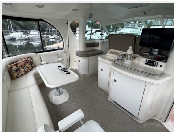
sea ray 19