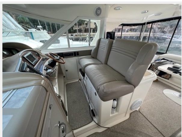
sea ray 11