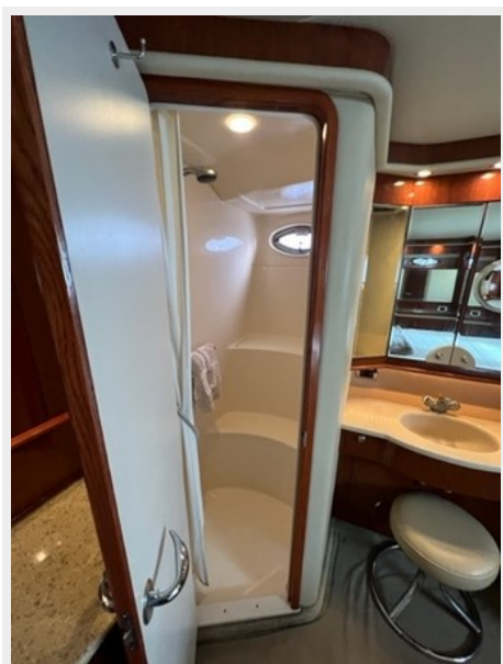
sea ray 49