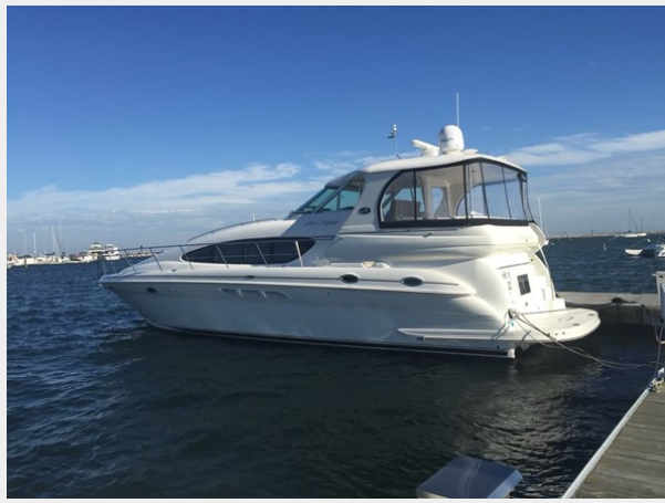
sea ray 1