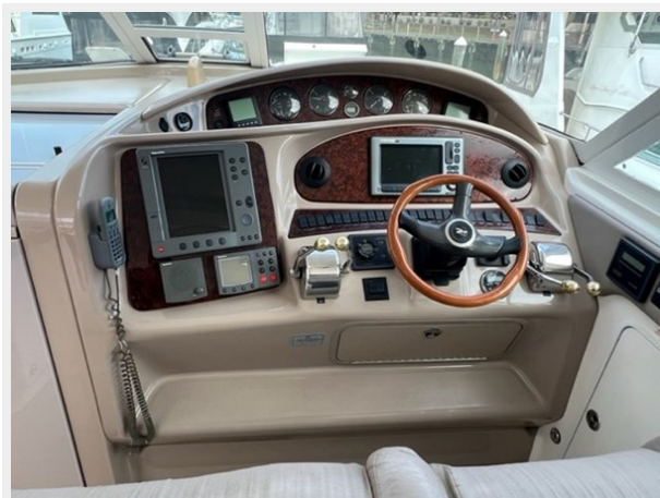
sea ray 5