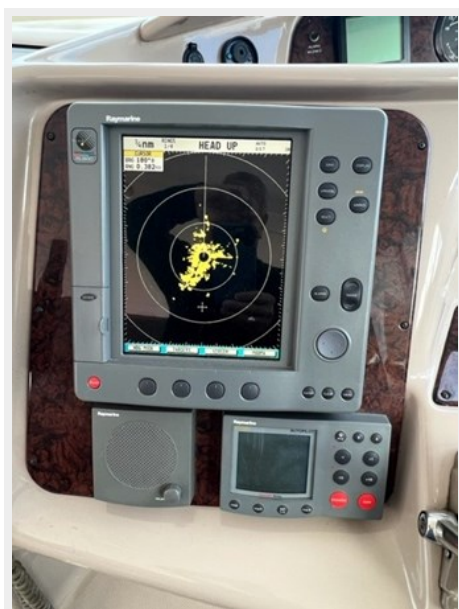
sea ray 7