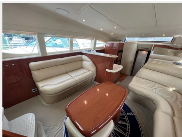
sea ray 29