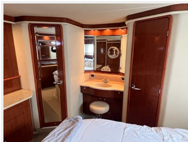
sea ray 48