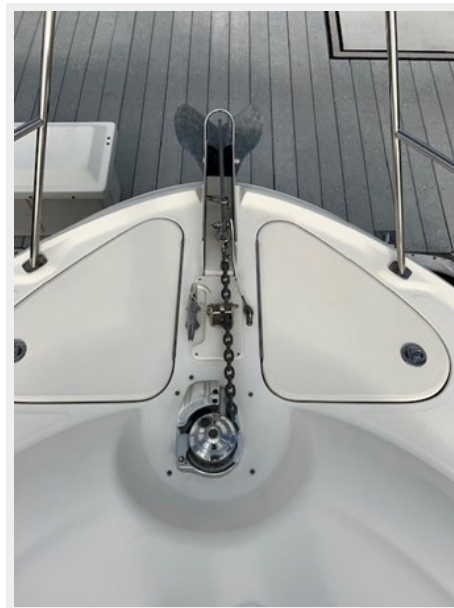
sea ray 56