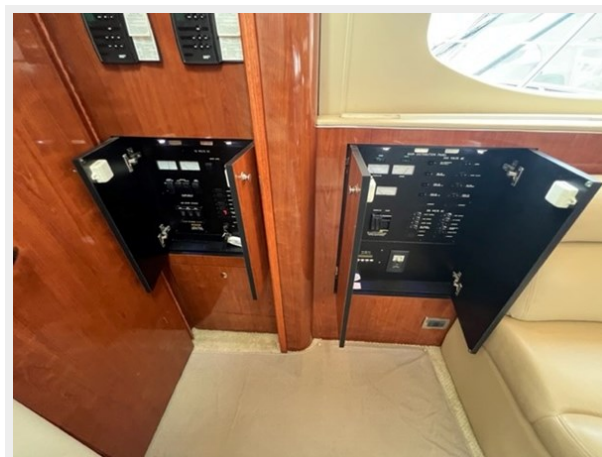
sea ray 26