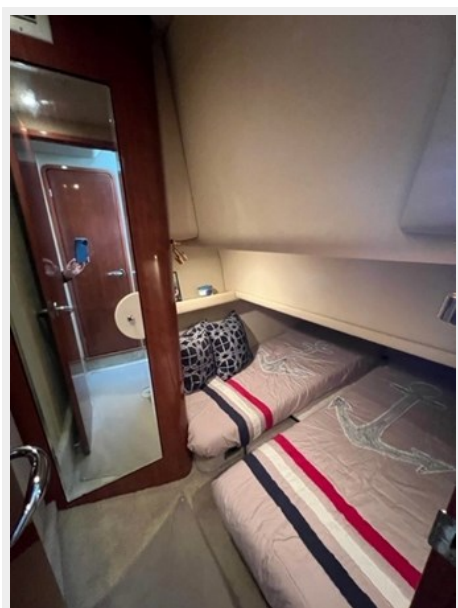
sea ray 43