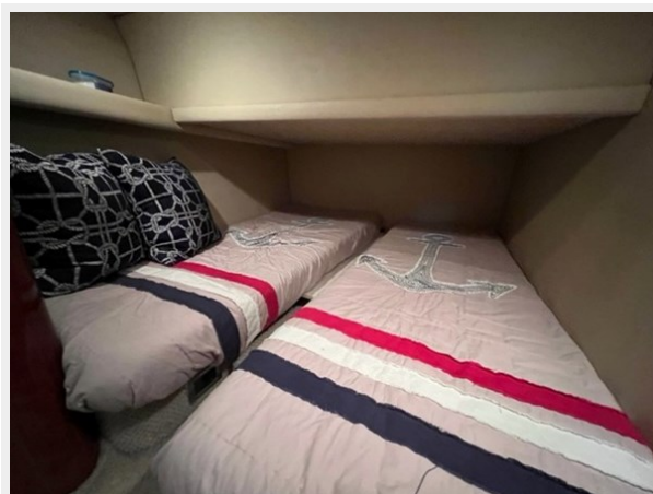
sea ray 42