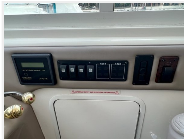
sea ray 10