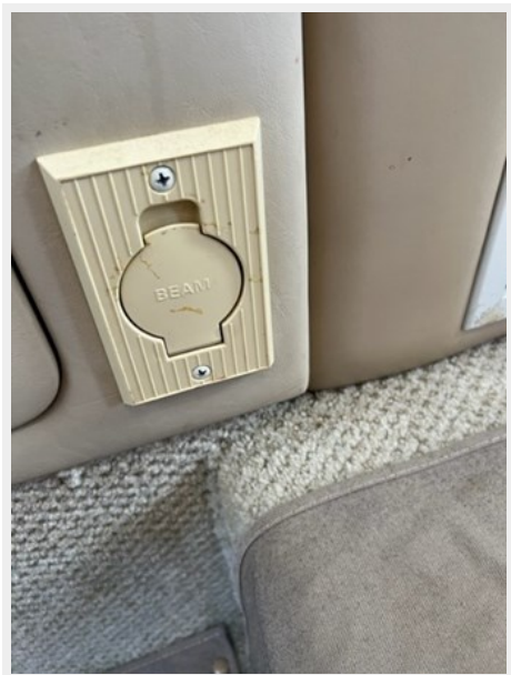
sea ray 37