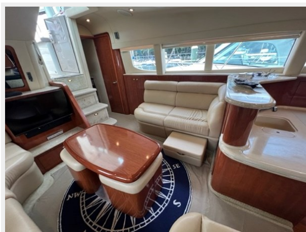
sea ray 23