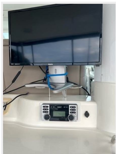
sea ray 15