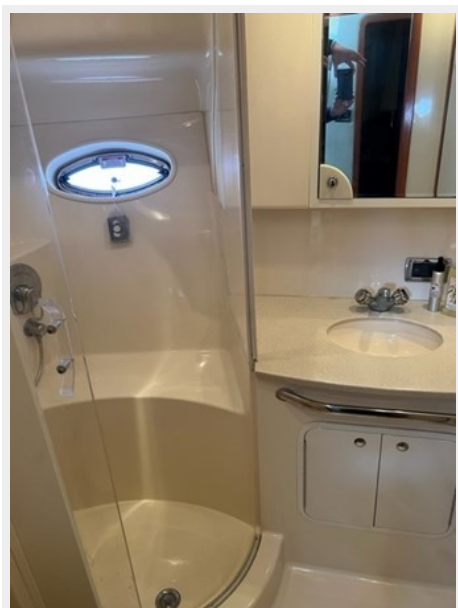
sea ray 41