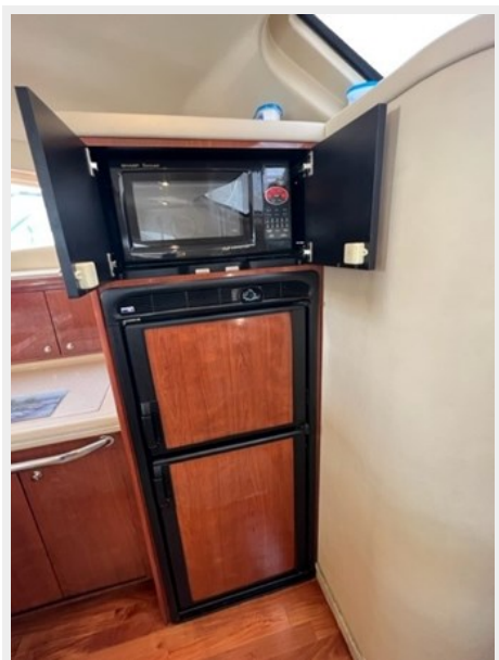
sea ray 33