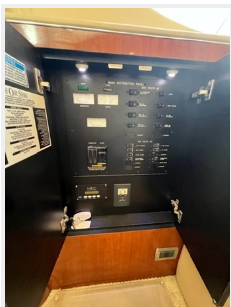
sea ray 27