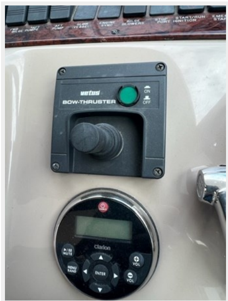
sea ray 9