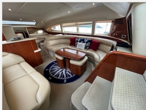
sea ray 22