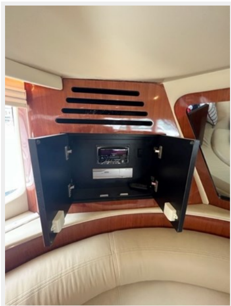
sea ray 25