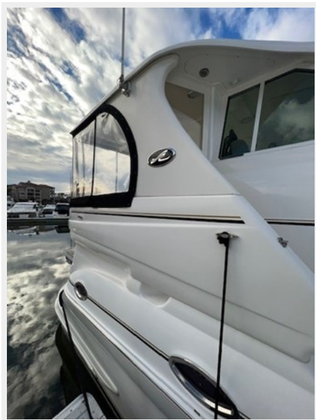
sea ray 59