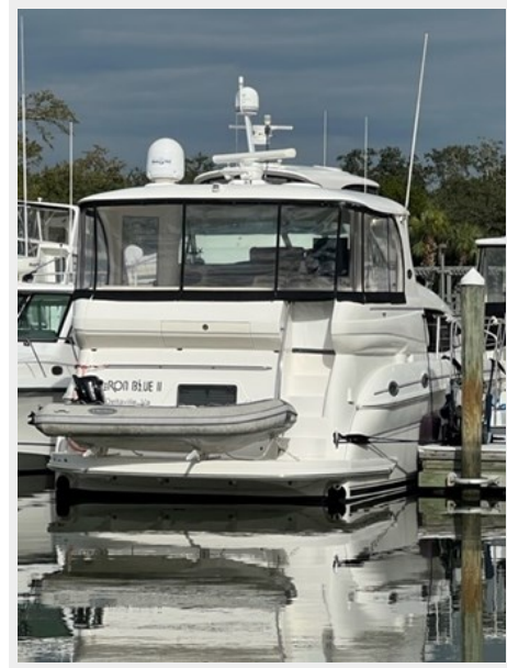
sea ray 2