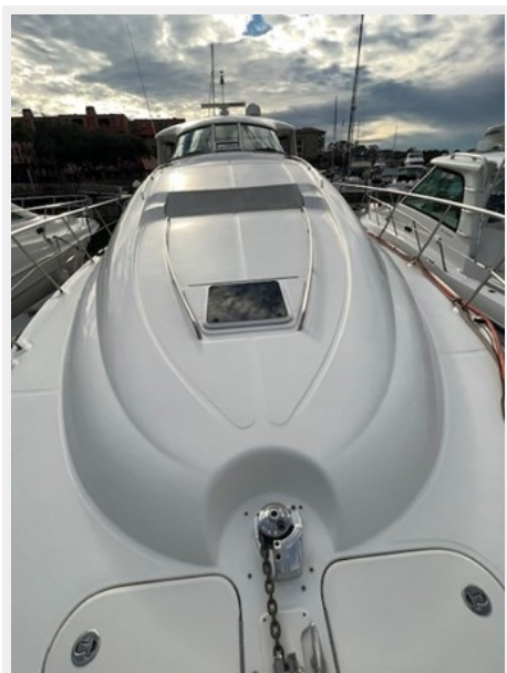
sea ray 57