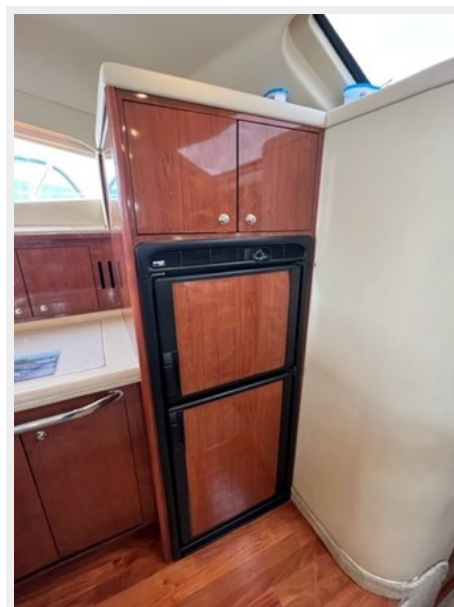
sea ray 32