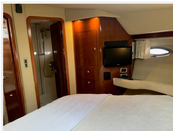
sea ray 39