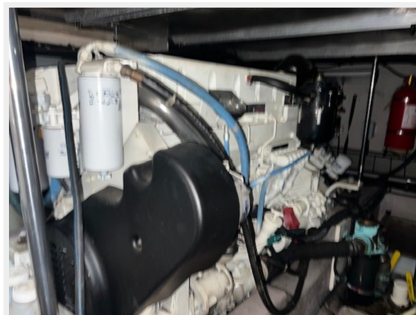
sea ray 52