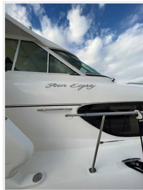
sea ray 60