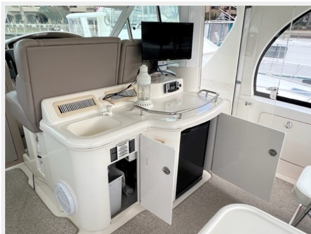
sea ray 13