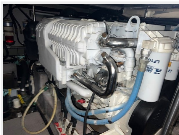
sea ray 53