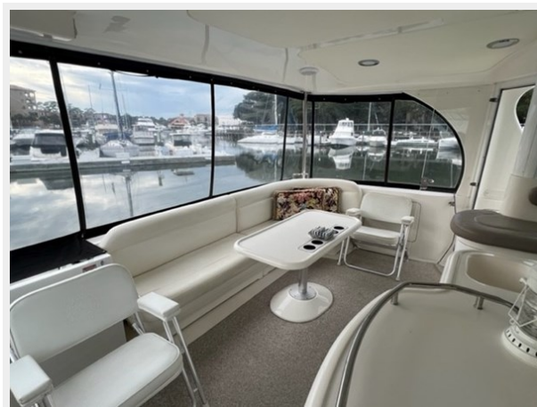
sea ray 18