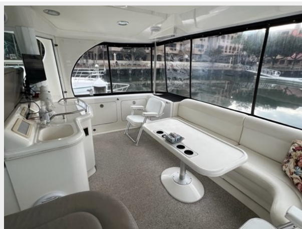
sea ray 17