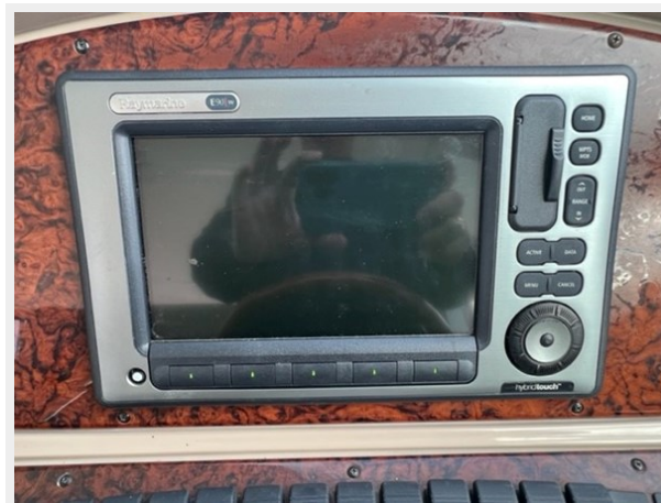
sea ray 6