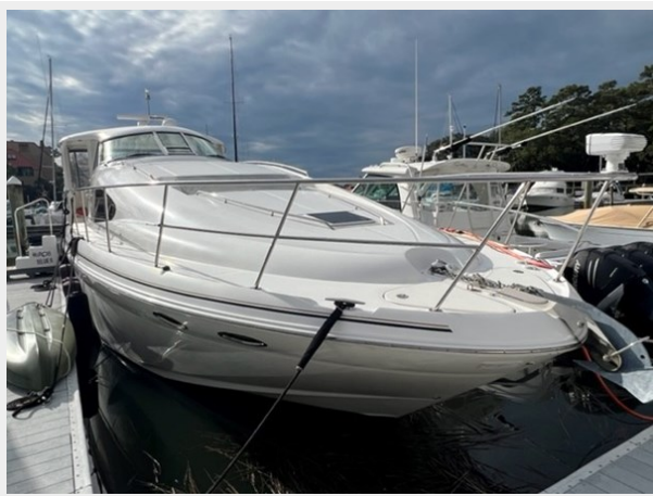
sea ray 3