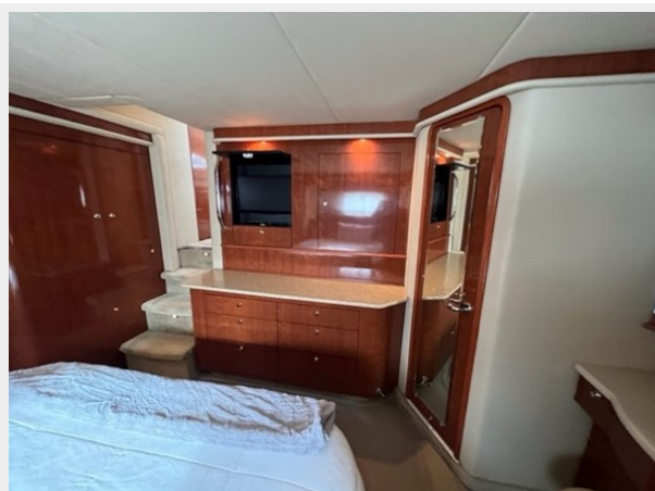
sea ray 47