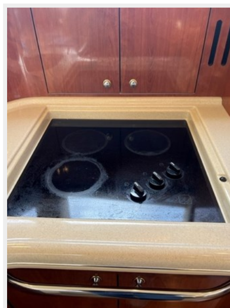
sea ray 36