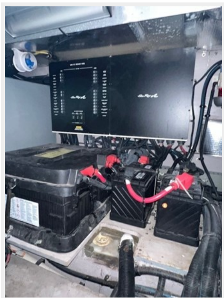
sea ray 51