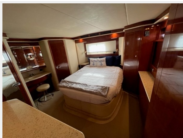
sea ray 45