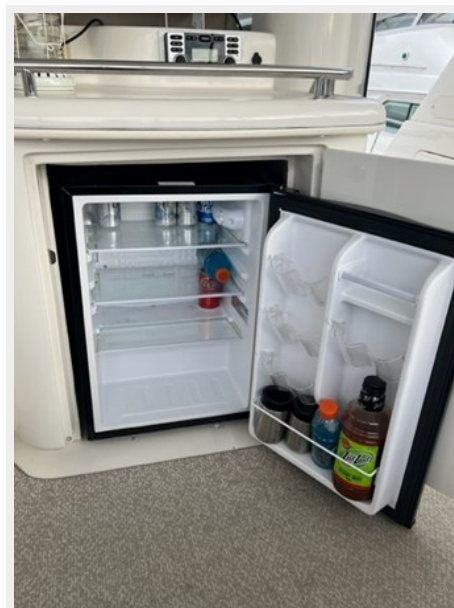
sea ray 14