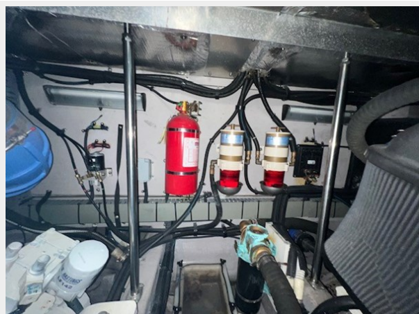
sea ray 55