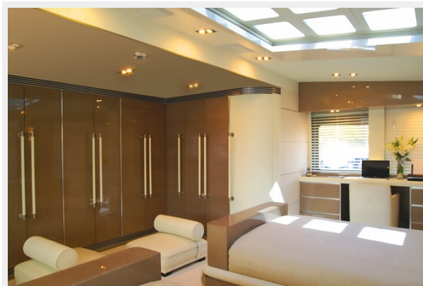
New Master Cabin 5 (1)