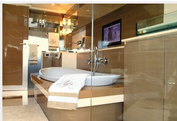
Master Bath 1 (1)