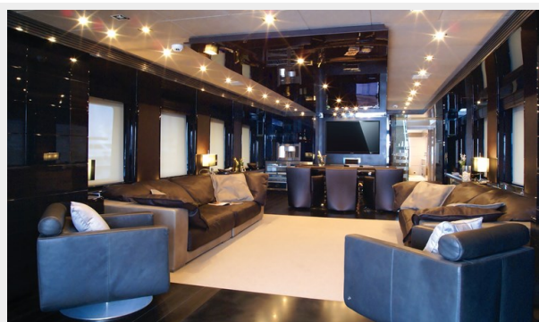
Main Deck Salon (1)