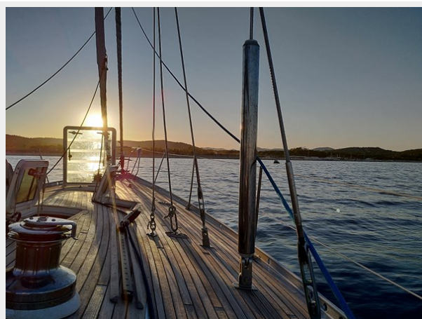
Anchor sunset 1