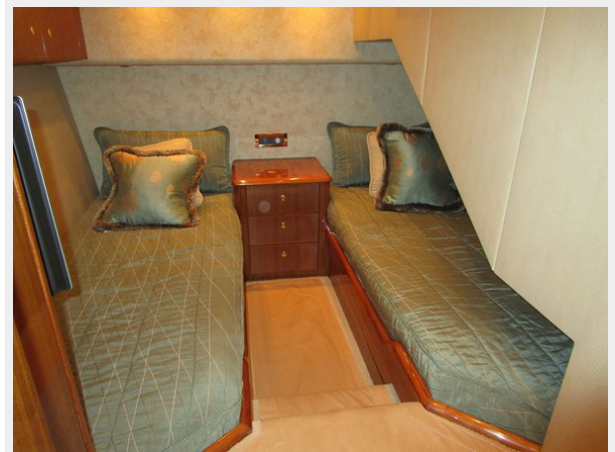
Stbd. Side Twin Looking Aft