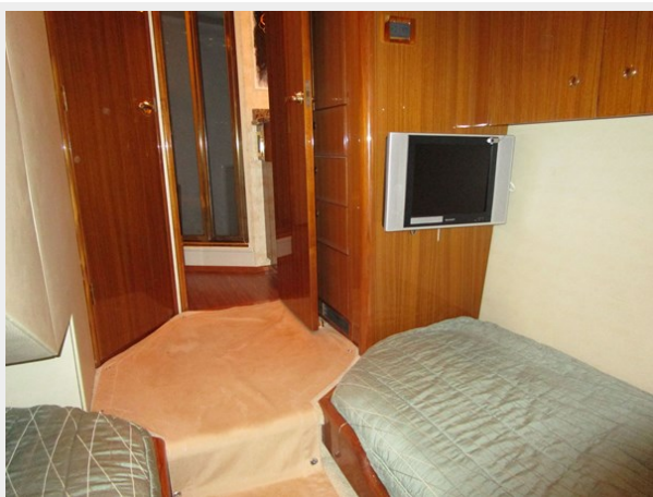
Stbd. Side Twin Looking Forward