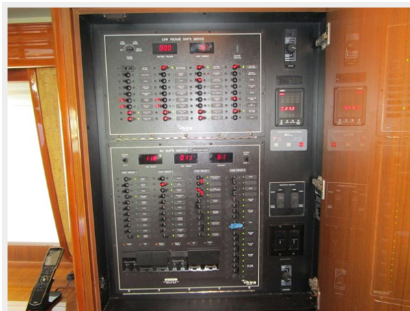
Salon Electric Panel