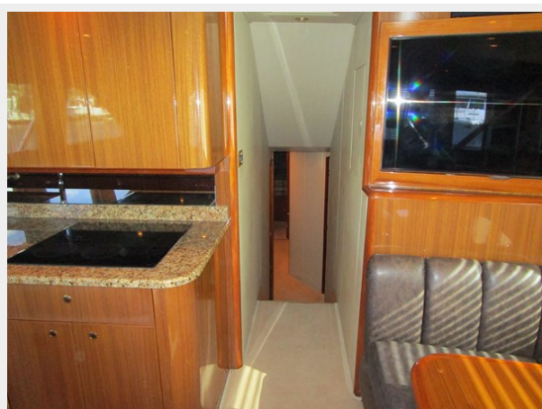
Companionway to Below