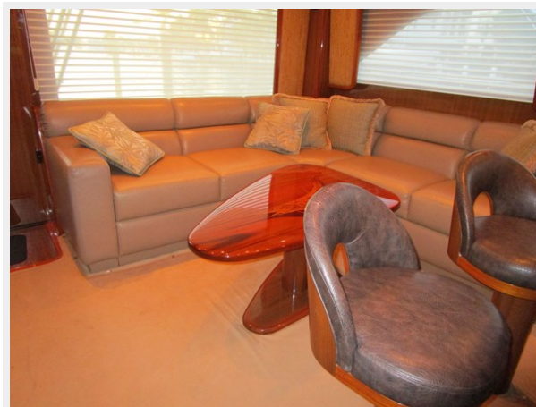
Salon to Port