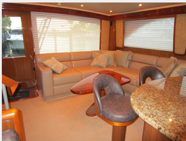
Salon Looking Aft