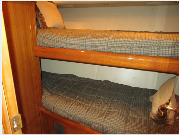
Stbd. Side Bunk Room