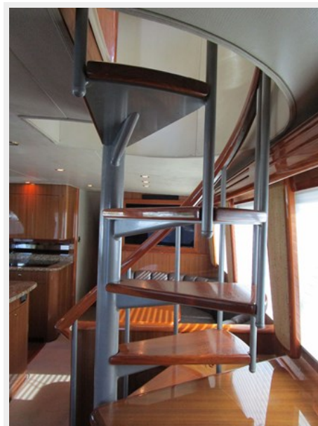
Enclosed Flybridge Steps