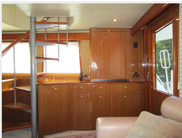
Salon to Stbd.