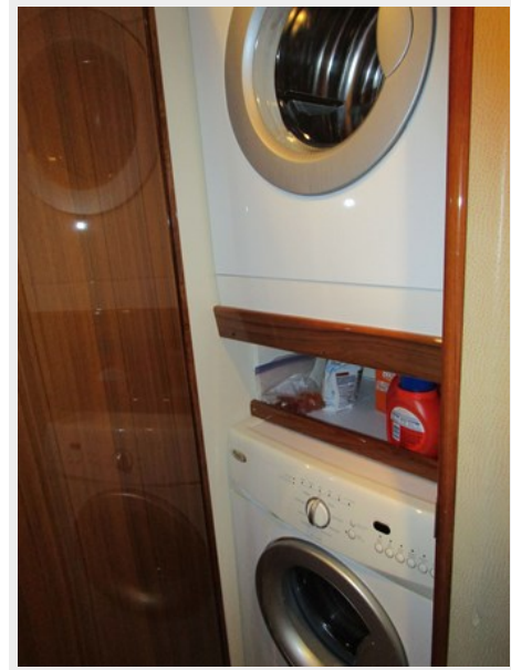
Companionway Laundry Center