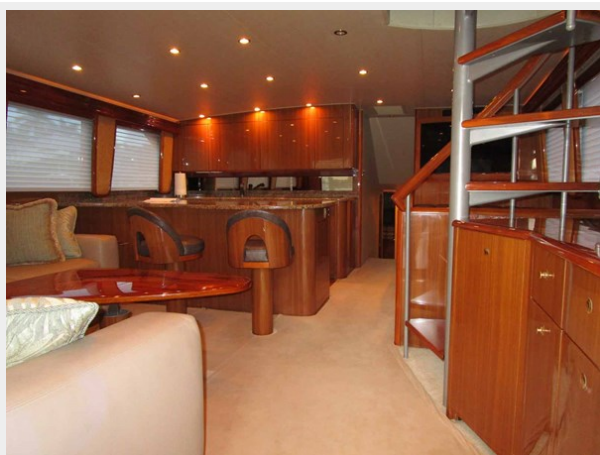
Salon Looking Forward