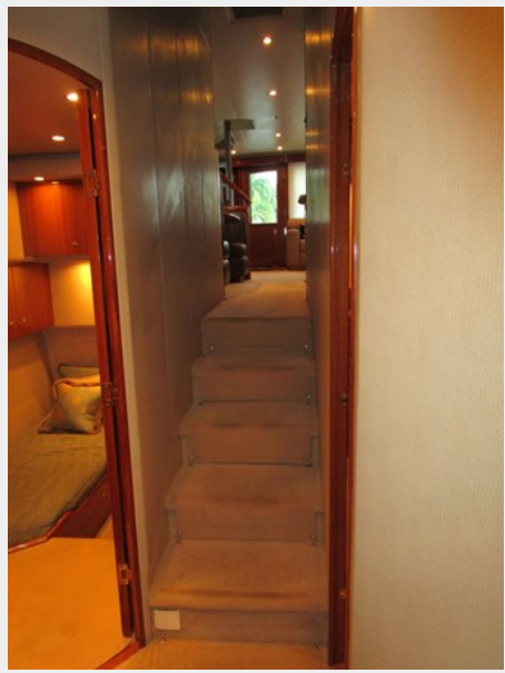
Companionway Looking Aft