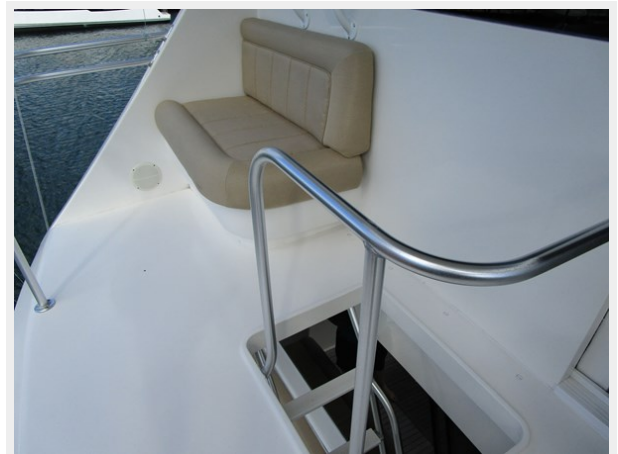
Bridge Deck Seating