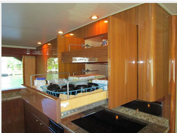
Ample Pull Out Storage