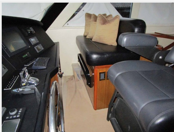
Starboard Helm Seat