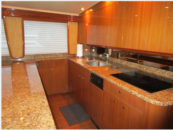
Galley Looking Forward