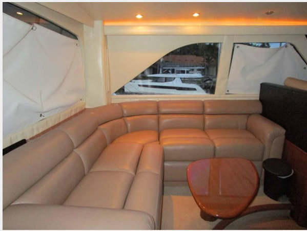
Enclosed Bridge Settee