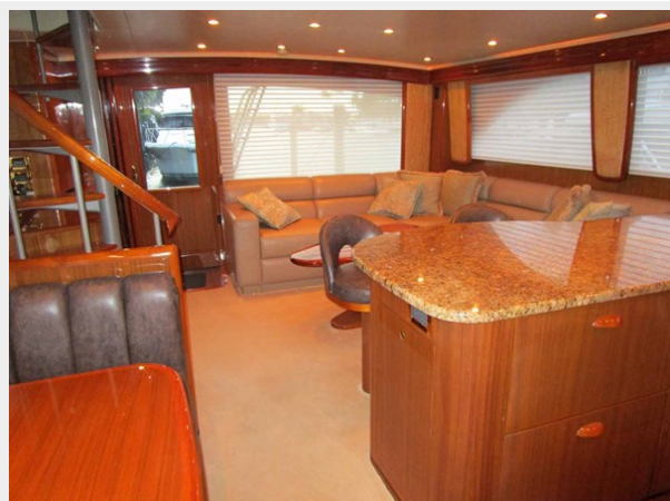
Salon Looking Aft