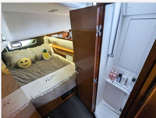
Aft Port Cabin