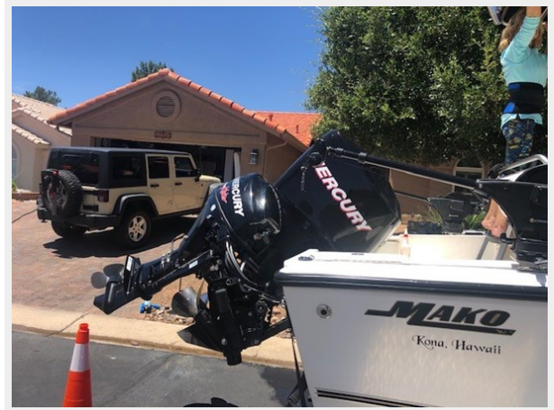
fishing tales 17