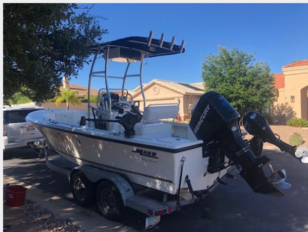
fishing tales 5