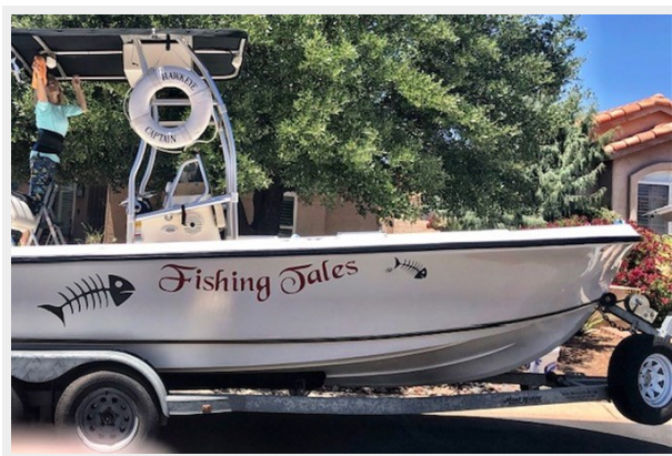
fishing tales 1