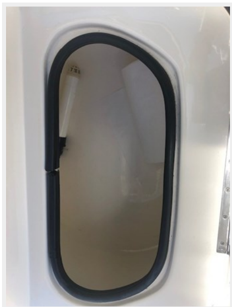
fishing tales 24