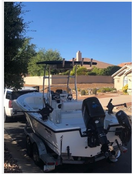
fishing tales 6