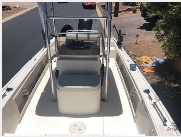
fishing tales 14