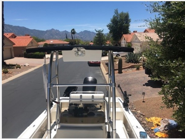
fishing tales 15