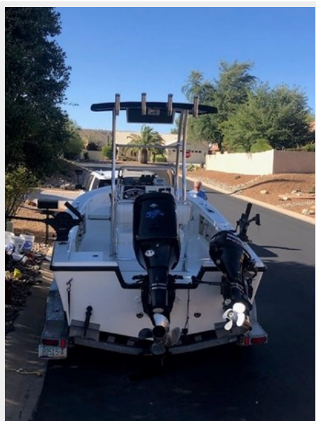
fishing tales 7