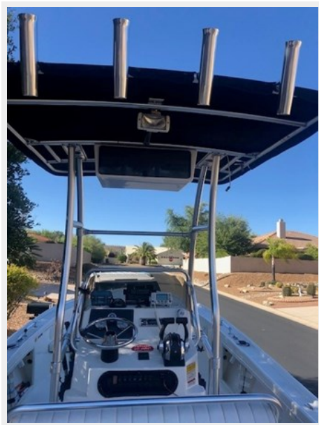
fishing tales 4