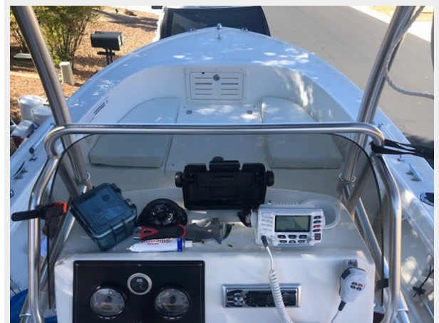
fishing tales 30