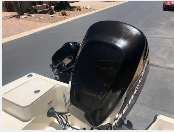
fishing tales 21