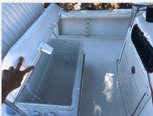
fishing tales 34