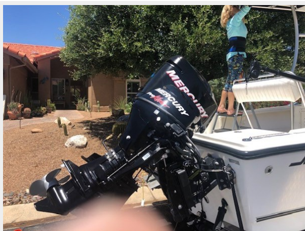
fishing tales 18