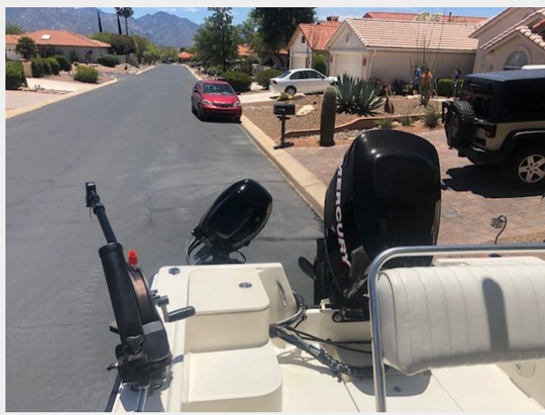
fishing tales 23