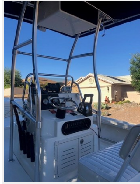
fishing tales 10