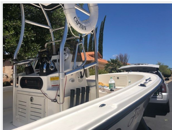
fishing tales 2