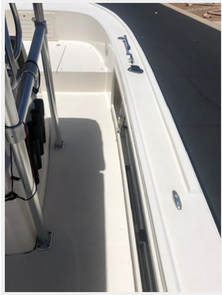
fishing tales 27