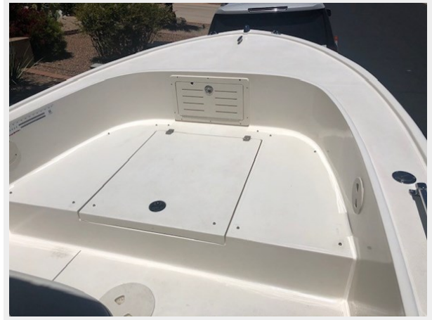
fishing tales 13