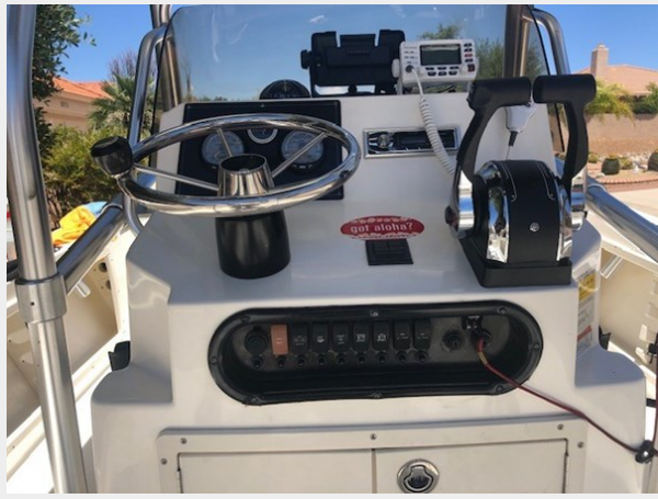
fishing tales 12