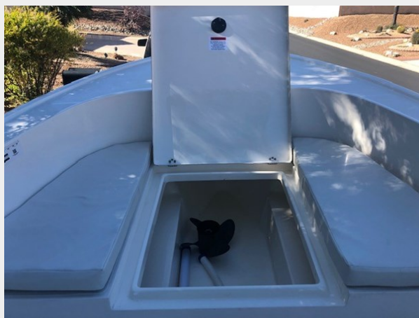
fishing tales 29