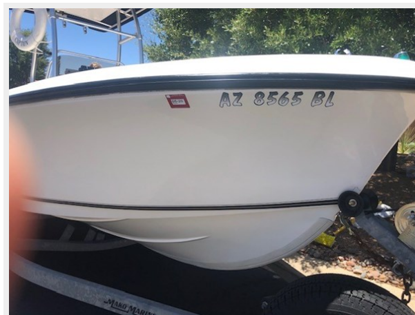
fishing tales 3