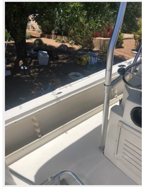
fishing tales 28