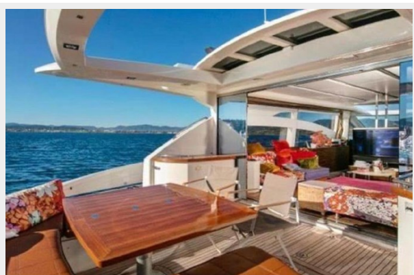
EXTERIOR TABLE ABSOLUTE