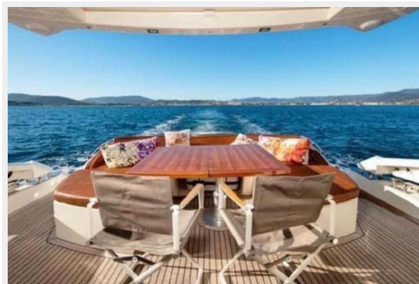
EXTERIOR TABLE ABSOLUTE 2