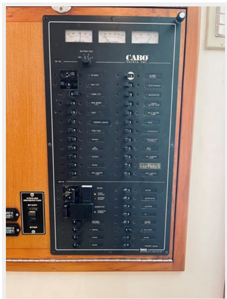
20_1999 31ft Cabo 31 Open SEA SQUIRREL