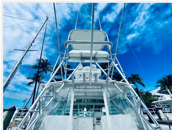
3_1999 31ft Cabo 31 Open SEA SQUIRREL