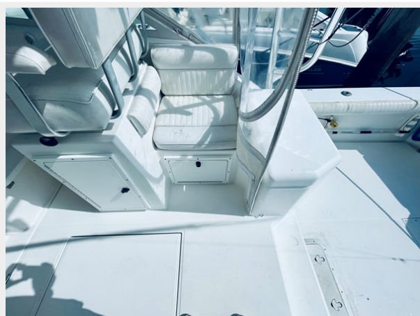
6_1999 31ft Cabo 31 Open SEA SQUIRREL