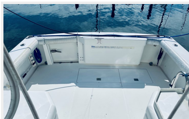
5_1999 31ft Cabo 31 Open SEA SQUIRREL