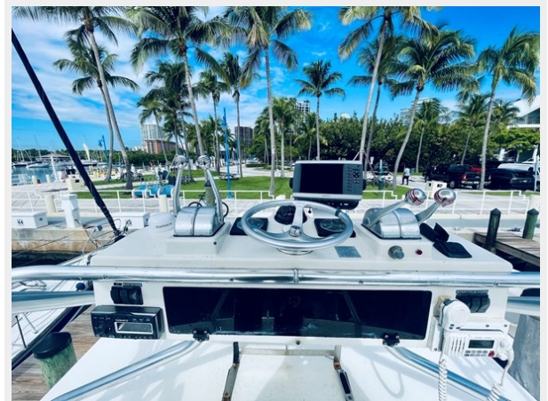
11_1999 31ft Cabo 31 Open SEA SQUIRREL