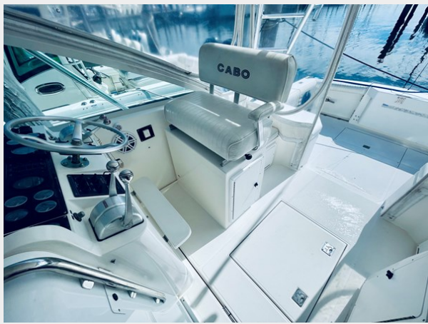
8_1999 31ft Cabo 31 Open SEA SQUIRREL