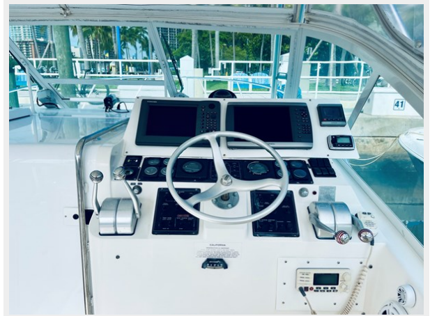
9_1999 31ft Cabo 31 Open SEA SQUIRREL