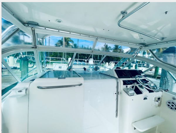
10_1999 31ft Cabo 31 Open SEA SQUIRREL