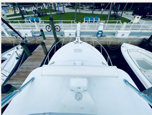
12_1999 31ft Cabo 31 Open SEA SQUIRREL