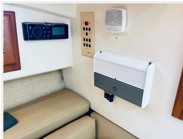
21_1999 31ft Cabo 31 Open SEA SQUIRREL