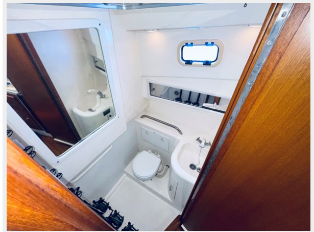
16_1999 31ft Cabo 31 Open SEA SQUIRREL 17_1999 31ft Cabo 31 Open SEA SQUIRREL