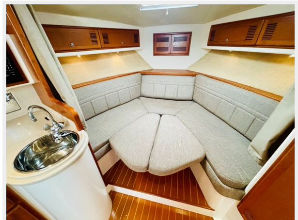
18_1999 31ft Cabo 31 Open SEA SQUIRREL 19_1999 31ft Cabo 31 Open SEA SQUIRREL