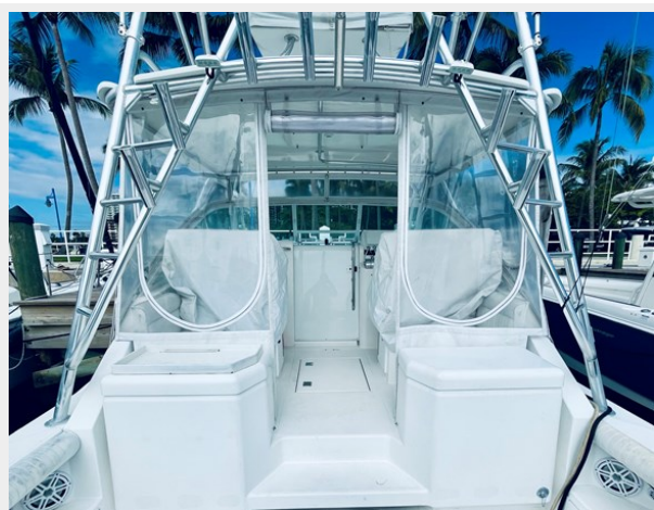
4_1999 31ft Cabo 31 Open SEA SQUIRREL