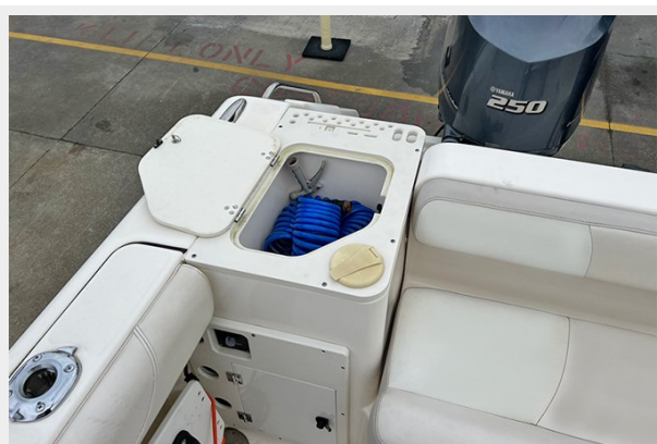
Cockpit Live Well