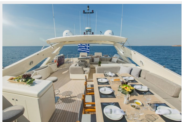
Flybridge Bimini Closed