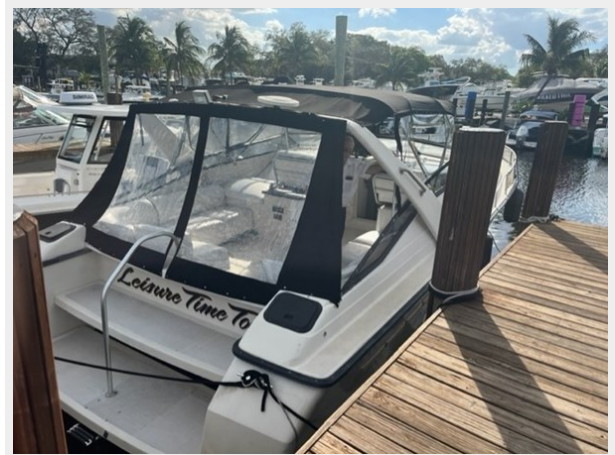
2. Aft Deck