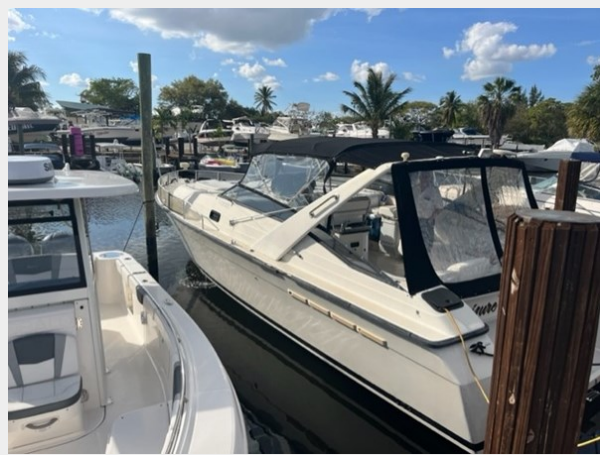
1. Port Exterior