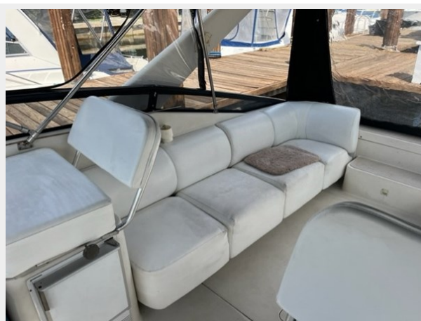
5. Cockpit Lounge