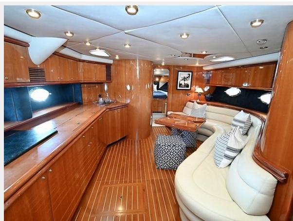
004 Main Salon